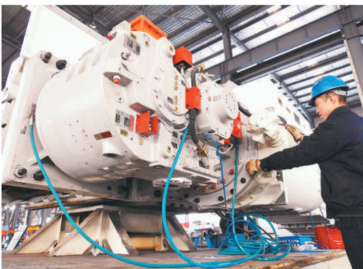
1月28日,位于江苏连云港市海州区的天明机械集团有限公司,工人在调试8.8米智能大采高工作面刮板输送机成套设备。当日,世界首台套8.8米智能大采高工作面刮板输送机成套设备在天明机械集团下线。经专家现场评议,该产品可满足大型煤矿厚煤层、大采高、高产高效集约化、智能化综采生产的要求。