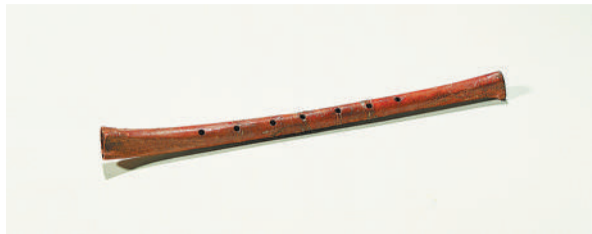
珍藏在河南博物院的贾湖骨笛。(资料图片)

河南博物院珍藏的数十万件文物中,有“九大镇院之宝”。其中,贾湖骨笛是“镇院之宝”中唯一一件史前神器。一根不长的笛子凝结着八千年风雨。