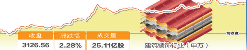
1月18日波动最大行业走势图