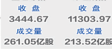
深证成指 收盘 11303.97 成交量 213.52亿股