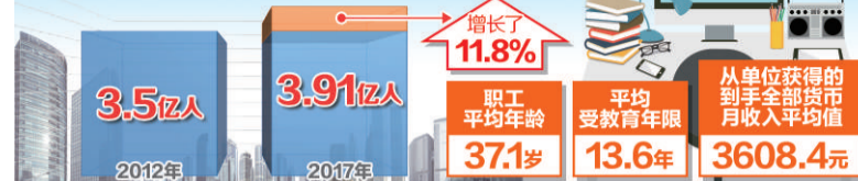
2017年全国职工总数达3.91亿人