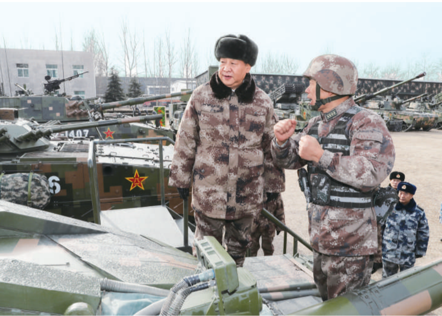
1月3日,中共中央总书记、国家主席、中央军委主席习近平视察中部战区陆军某师。这是习近平登上99A坦克,详细了解装备战技性能。