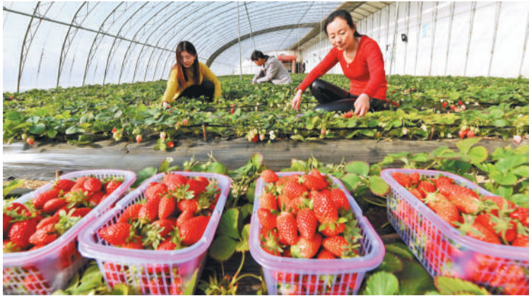
生态休闲农业鼓起农民“钱袋子”。图为游客在河北省临西县杨圈村一家庭农场采摘园采摘草莓。新华社记者 朱旭东摄

乡村旅游、农村电子商务、特色小镇、设施农业等农村新产业新业态用地将获政策支持。国土资源部近日表示,各地可以安排一定比例年度土地利用计划,专项支持农村新产业新业态和产业融合发展。