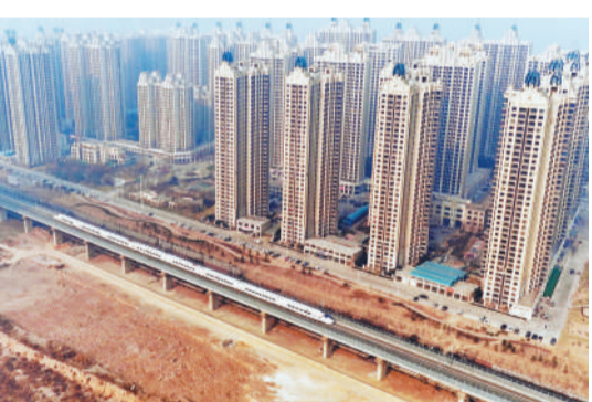
△2017年12月28日，石家庄至济南高速铁路开通运营，石家庄至济南的列车运行时间由原来的3小时47分缩短至最快2小时9分。