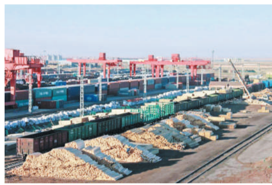
△截至2017年12月26日，内蒙古二连铁路口岸完成进口运量1122万吨，同比增长16%；通行出境中欧班列570列，同比增长2.4倍，均创历史新高。