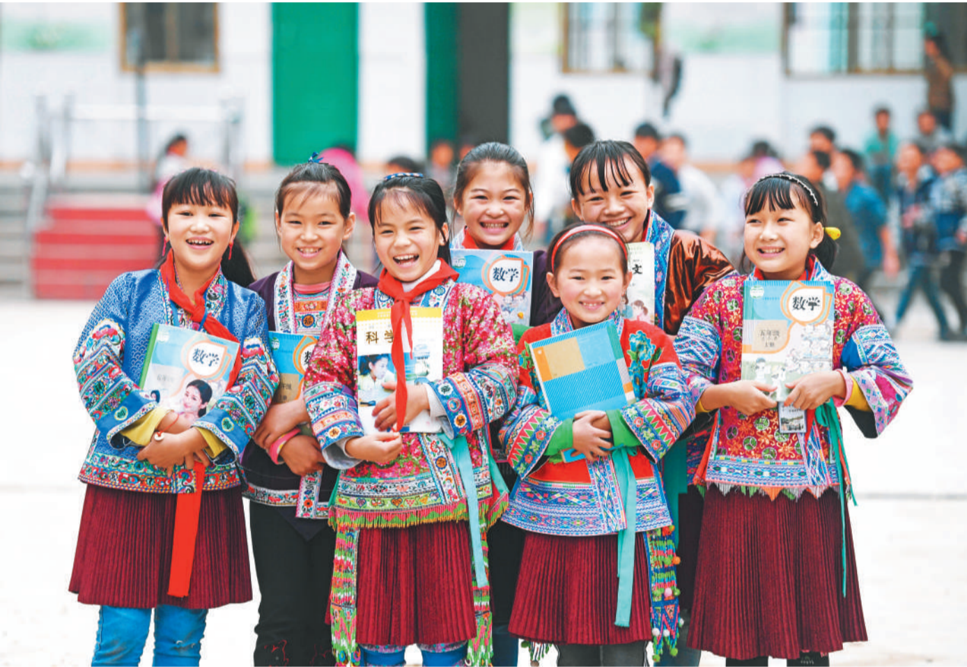
这是广西壮族自治区融水苗族自治县白云乡中心校红瑶女童班的女童(11月29日摄)。广西集“老、少、边、山、穷”于一体，是全国脱贫攻坚的主战场之一。据统计，广西贫困人口数量已从2010年的1012万减少到目前的363.8万。