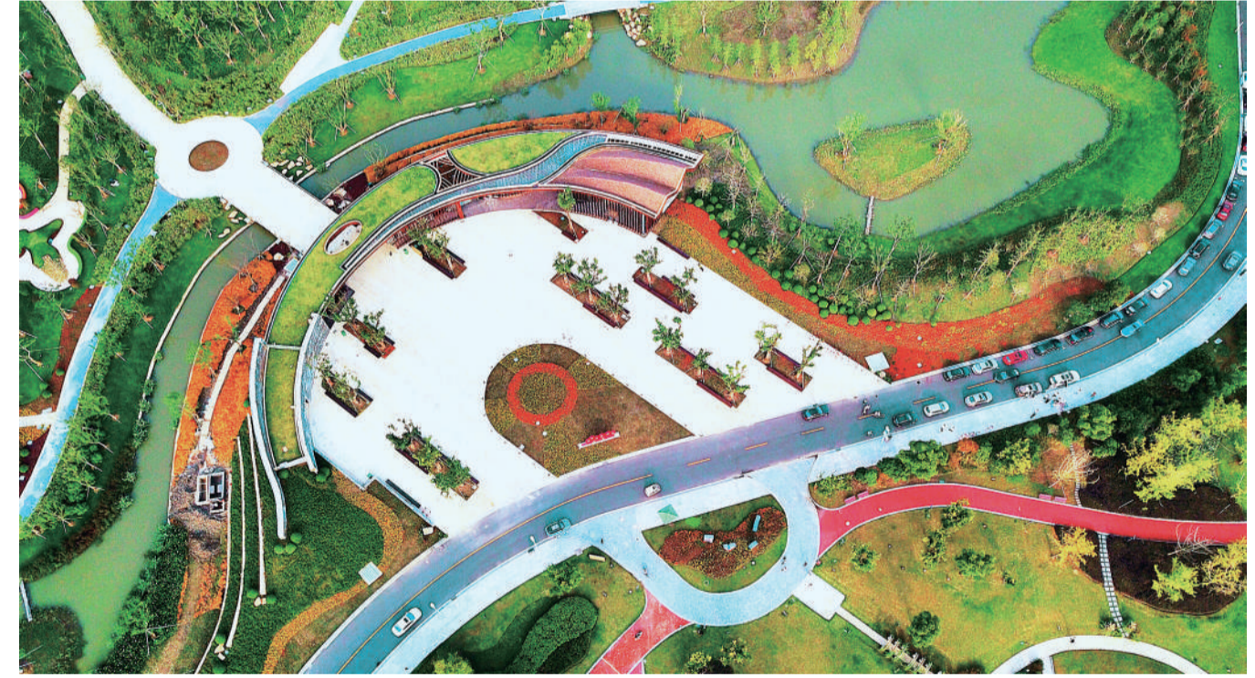
昔日城中村 今天美湿地

《通知》指出,《中华人民共和国环境保护税法》将于2018年1月1日起施行。根据该法规定,在中华人民共和国领域和中华人民共和国管辖的其他海域,直接向环境排放应税污染物的企业事业单位和其他生产经营者为环境保护税的纳税人,应当依法缴纳环境保护税。国务院决定,环境保护税全部作为地方收入。