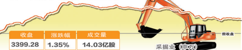
12月27日波动最大行业走势图