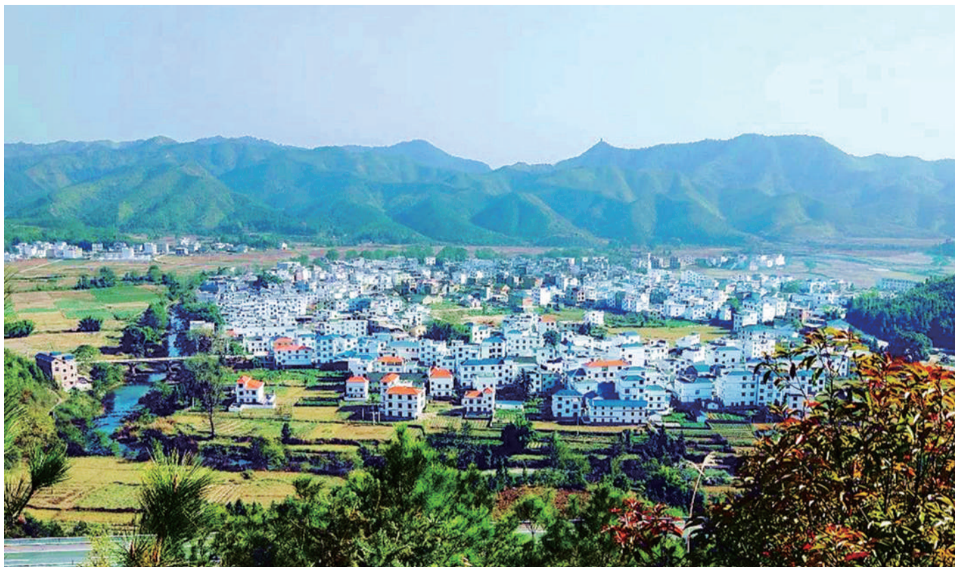
12月21日，江西安远县浮槎乡长河村蓝天如洗、群山连绵、绿水环绕，统一风格的村居鳞次栉比、美丽如画。近年来，安远县把整村推进作为改变农村面貌、建设美丽乡村、助力乡村振兴的重要举措，对农村环境进行全面治理，使乡村面貌焕然一新。

党的十八大以来我国环境改善速度之快“前所未有”，在大气治理领域体现得尤为明显。本月初，环境保护部部长李干