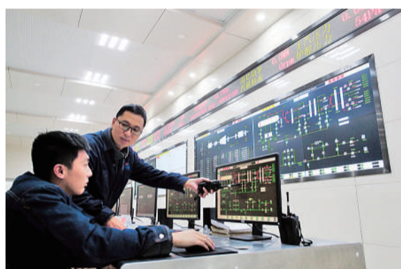
12月20日，在山东兴达新能源有限公司主厂房集控室，员工正在抄录系统数据，以便与现场设备实际情况进行核对。

杰表示，尽管离“大气十条”第一阶段收官考核还剩最后一个月，但从目前情况来看，“大气十条”考核目标有望圆满完成。