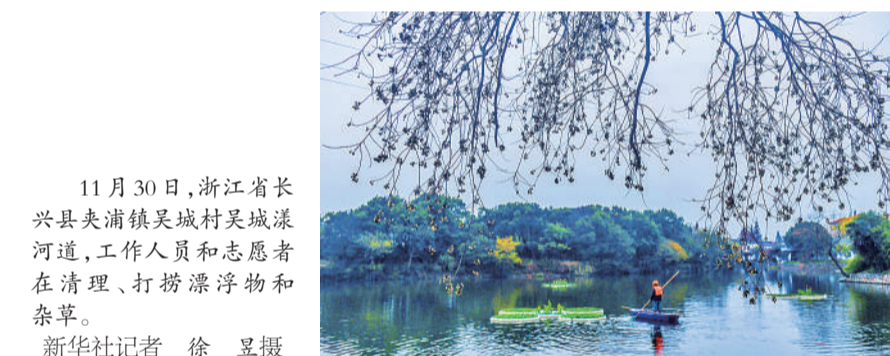
11月30日，浙江省长兴县夹浦镇吴城村吴城漾河道，工作人员和志愿者在清理、打捞漂浮物和杂草。