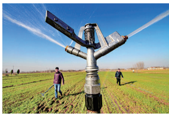
近年来，河北省魏县针对地下水资源匮乏的现实，通过综合治理，共改善农业节水灌溉面积45万余亩。图为前大磨乡李枣林村一架正在运行的固定式喷灌装置。