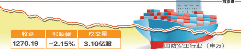
12月25日波动最大行业走势图