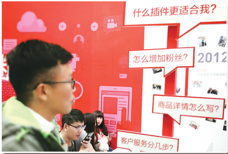
上图 如今做电商,卖货给粉丝已经成为一门必修的学问,这些粉丝就是潜在消费者。电子商务经营者既要为粉丝们做好服务,也要尊重消费者权益。图为消费者在研究如何在微信公众号里销售商品。