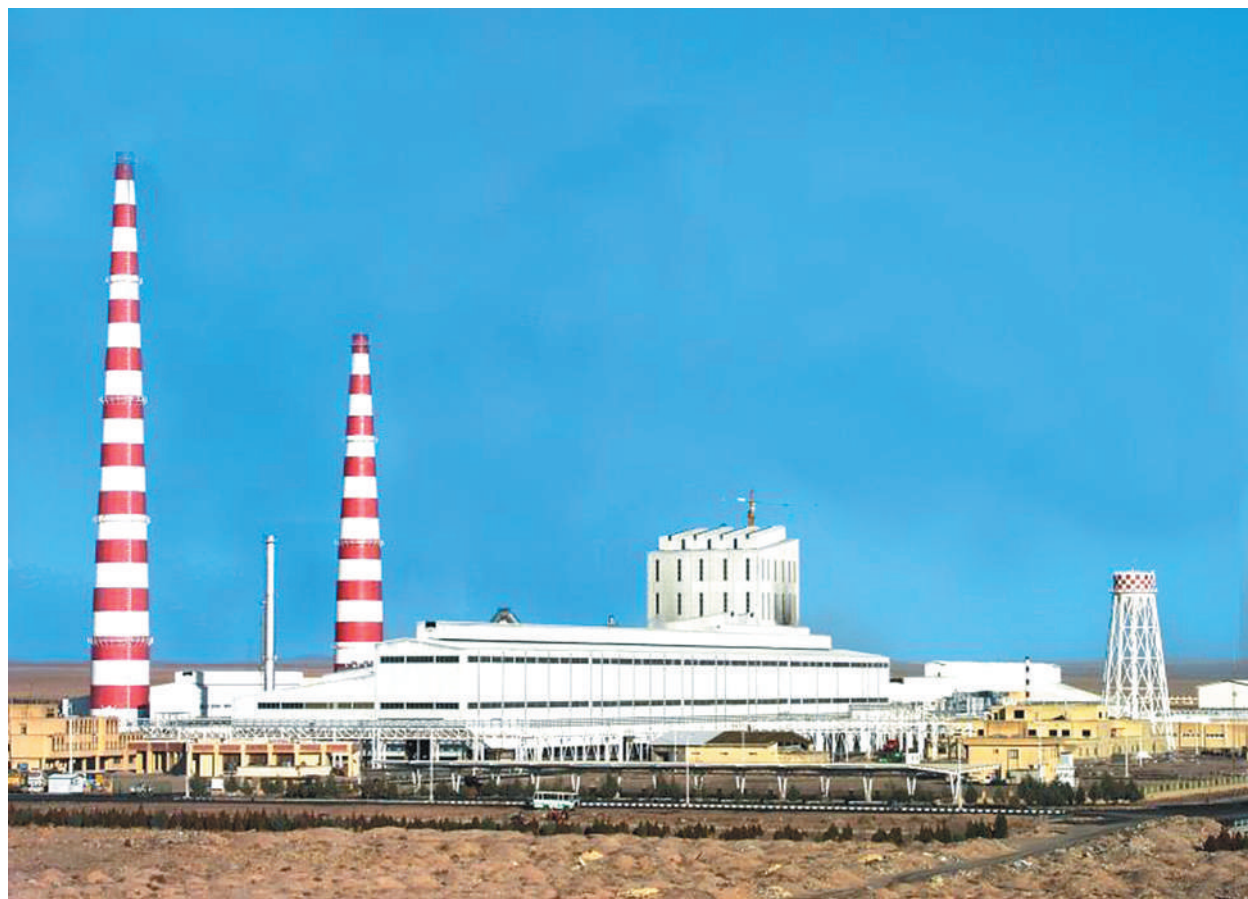
中色股份工程承包项目伊朗哈通阿巴德铜冶炼厂全景图。

近日,记者随深圳证券交易所调研组走访了新希望、科伦药业、华西能源、中色股份、易华录、京东方等6家深市上市公司。