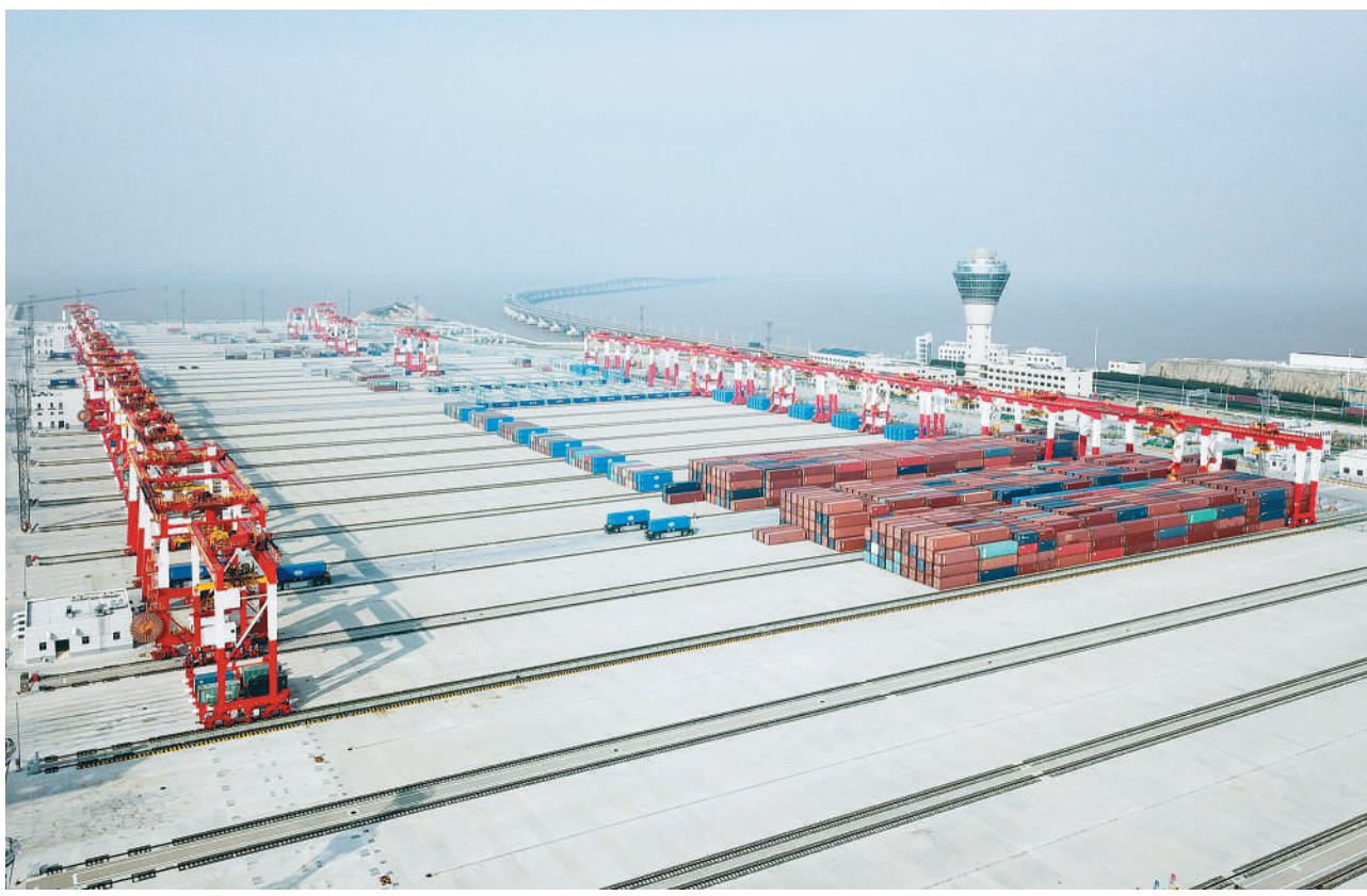
航拍上海洋山深水港四期自动化码头(12月10日摄)。

运营方上港集团表示,今后将致力于建立集互联网、物联网和码头自动化技术为一体的、系统化的港口生态圈。