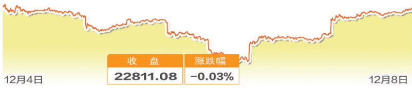
日经225指数一周走势图