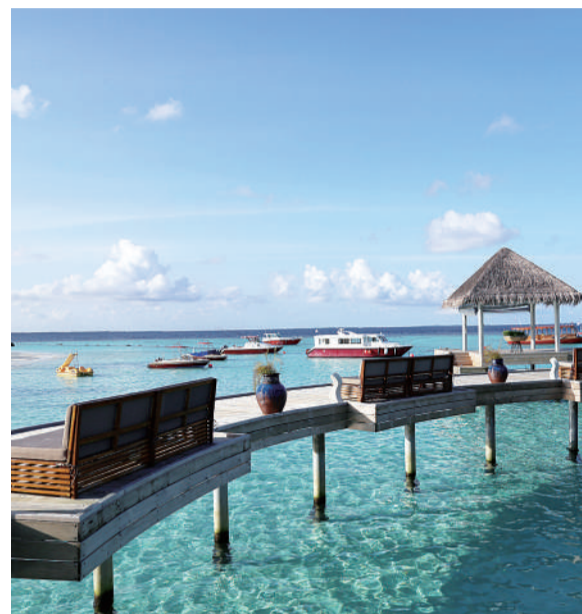
海边的很多水屋都是用木材建成,体现了可持续旅游的理念。

当你戴上浮潜面罩,一头扎进蔚蓝色近乎不真实的大海,一切都变得异乎寻常的安静。所有的人语喧哗、所有的机器轰鸣、所有的电话信号……一瞬间,全部消失。眼前只有一方新奇的海底世界,珊瑚、鱼,还有折射在海里的光影。