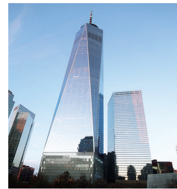
纽约街头的摩天大楼依旧如昨。

1988年夏,我从加拿大来到纽约。第一次看到那么高的大楼,使劲抬头才能看到天空。每个人匆匆的脚步