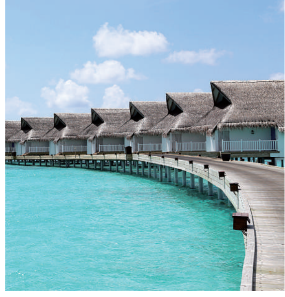
马尔代夫的海边,充满温馨的气息。

拍摄星空是很讲求技巧的,因为曝光时间比较长,就需要一台单反相机,最好配备广角镜头;一个牢固一点的三脚架,放三脚架的时候,要用力把地面上的沙子踩实一点,避免不必要的震动;一个手电筒,方便随时补充。此外,构图时还要稍微留一点地面,突出成像的韵味。好在同行的小伙伴深谙此道,早早做好了准备,将那时的星空定格在了照片中。