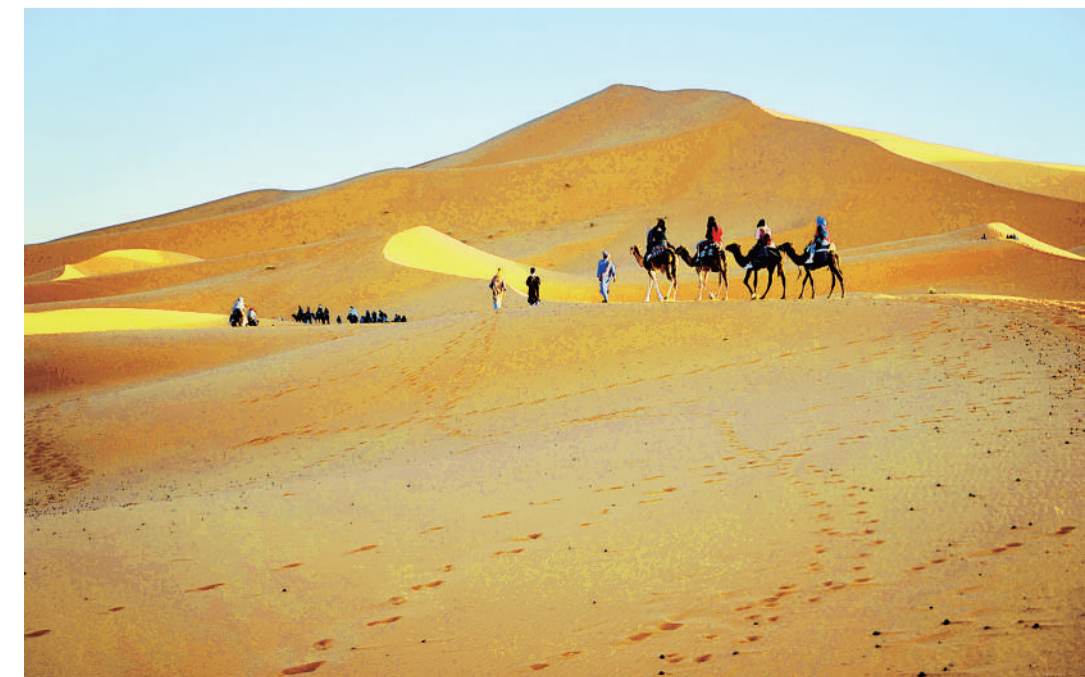
伴着日落,行进在撒哈拉沙漠中的游客的骆驼队。

拍摄星空是很讲求技巧的,因为曝光时间比较长,就需要一台单反相机,最好配备广角镜头;一个牢固一点的三脚架,放三脚架的时候,要用力把地面上的沙子踩实一点,避免不必要的震动;一个手电筒,方便随时补充。此外,构图时还要稍微留一点地面,突出成像的韵味。好在同行的小伙伴深谙此道,早早做好了准备,将那时的星空定格在了照片中。