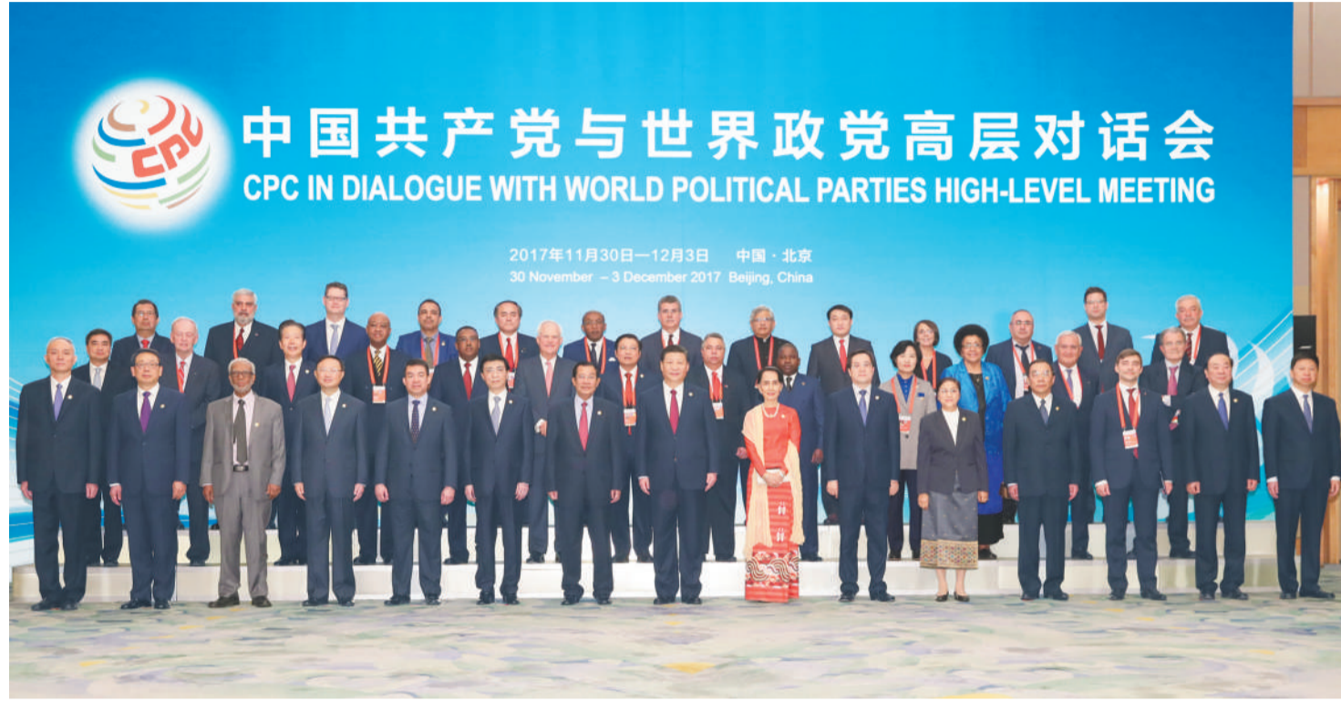
12月1日,中共中央总书记、国家主席习近平在北京人民大会堂出席中国共产党与世界政党高层对话会开幕式,并发表题为《携手建设更加美好的世界》的主旨讲话。