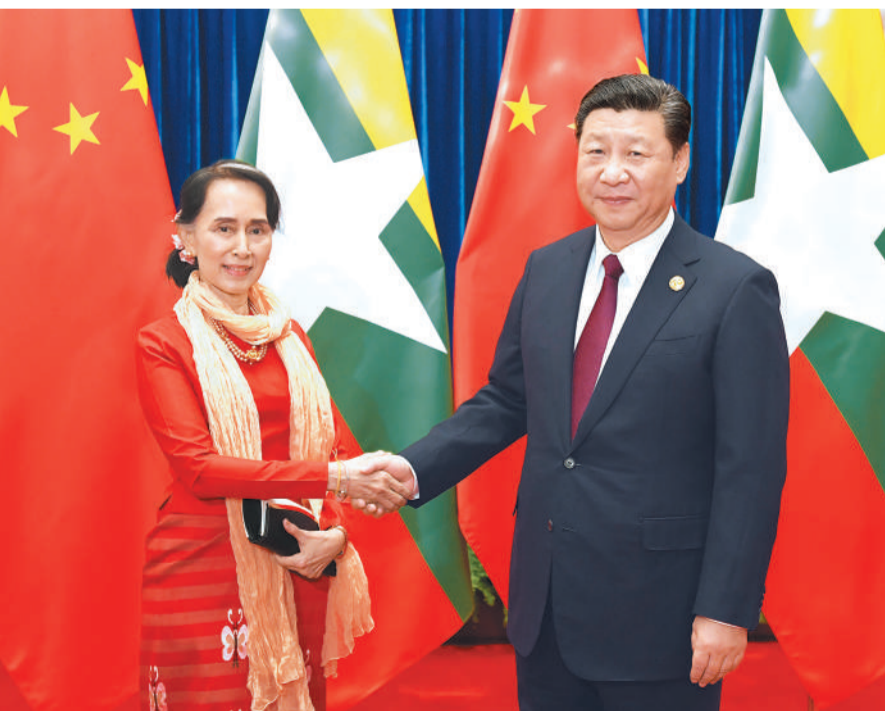
12月1日,中共中央总书记、国家主席习近平在北京人民大会堂会见前来出席中国共产党与世界政党高层对话会的缅甸国务资政昂山素季。