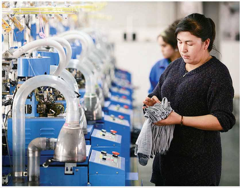
新疆库车县电毡小微企业创业园小微企业逐步发展壮大,带动当地500余人实现就业。图为新疆库车县弘扬纺织有限公司的工人在整理制作好的棉袜。

浙江是民营经济大省,也是小微企业发展的沃土。2015年6月,《浙江省“小微企业三年成长计划”(2015—2017年)》发布,其中明确,要通过做加法、提质扶优,重点培育信息、环保、健康、旅游、时尚、金融、高端装备制造等8大产业小微企业10万家;通过做减法、倒逼劣汰,整治淘汰落