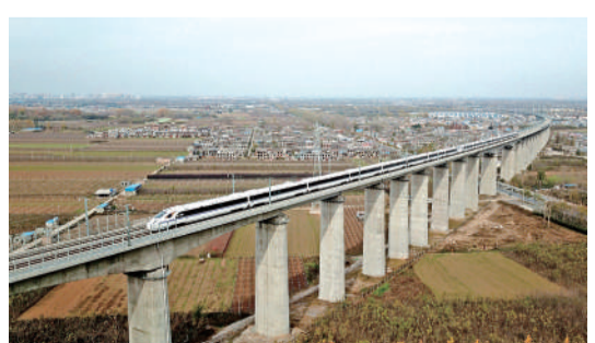
△11月22日，西成高铁进入全线拉通试验阶段，计划于今年年内开通运营。