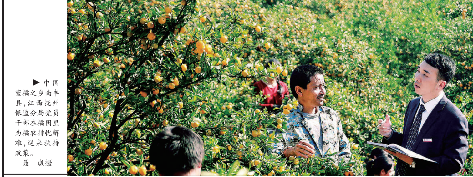
▶中国蜜橘之乡南丰县,江西抚州银监分局党员干部在橘园里为橘农排忧解难,送来扶持政策。 聂威摄