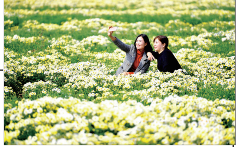
▲安徽亳州市谯城区十河镇,万亩毫菊种植基地毫菊盛开,菊香四溢。