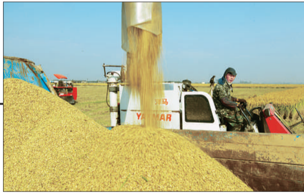
▶被称作皖南“粮仓”的安徽当涂县南圩万亩水稻进入收割期。