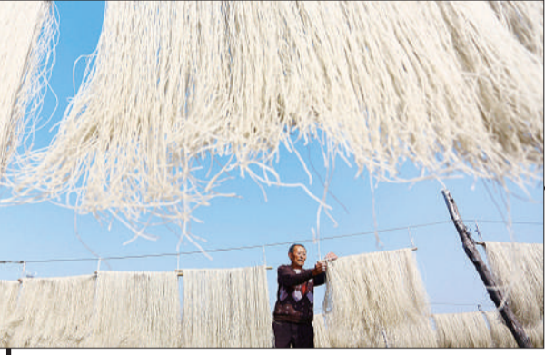
▲山东枣庄市山亭区,30余万亩无公害地瓜喜获丰收,农民在晾晒地瓜粉条。