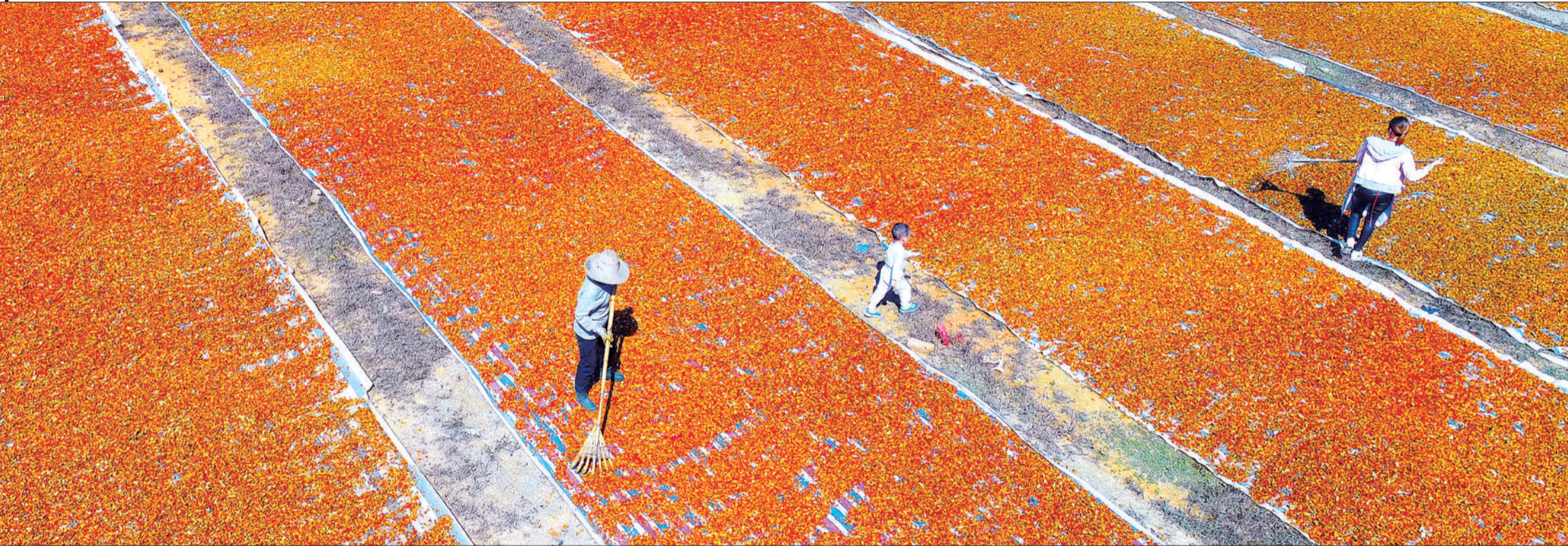
▲江西金溪县合市镇厚家山村农民在晾晒黄栀子。今年当地黄栀子喜获丰收。