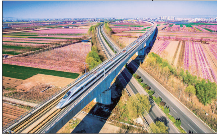
▲山西运城盐湖区,一列高铁穿过金色田野。