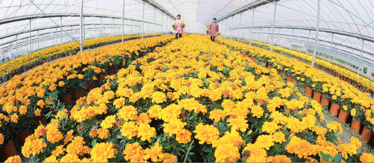
▲江苏海安经济技术开发区“花中花”园艺园里鲜花盛开,准备上市。