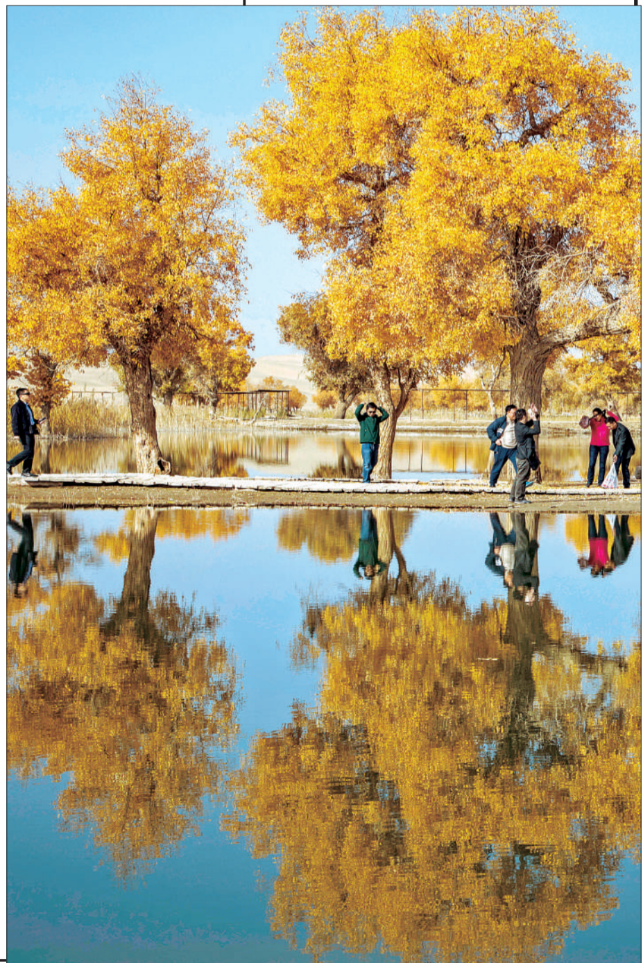
▼新疆尉犁的胡杨林就像一幅油画,完美展示了塞外独有的壮丽秋色。