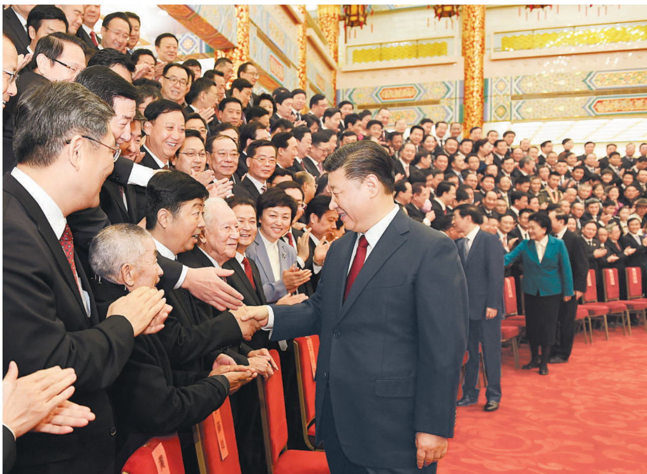
11月17日,全国精神文明建设表彰大会在北京人民大会堂举行。会前,习近平、王沪宁等会见与会代表。

大会为受表彰代表颁奖。第五届全国文明城市、全国文明村镇、全国文明单位代表,第一届全国文明校园代表,新一届全国未成年人思想道德建设工作先进代表,第六届全国道德模范代表分别在大会上发言。