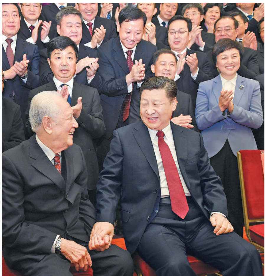
11月17日,全国精神文明建设表彰大会在北京人民大会堂举行。会前,习近平、王沪宁等会见与会代表。这是习近平邀请黄旭华、黄大发代表坐在自己身边合影。

新华社北京11月17日电(记者吴晶 黄小希) 全国精神文明建设表彰大会17日在京举行。中共中央总书记、国家主席、中央军委主席习近平在人民大会堂亲切会见参加大会的新一届全国文明城市、文明村镇、文明单位、文明校园、未成年人思想道德建设工作先进代表和全国道德模范代表,向全体代表表示热烈的祝贺,勉励他们再接再厉,在社会主义精神文明建设中再立新功、作出表率。