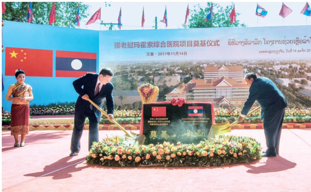
11月14日,中共中央总书记、国家主席习近平同老挝人民革命党中央委员会总书记、国家主席本扬在万象一道出席玛霍索综合医院奠基仪式。

本报万象11月14日电 记者关晋勇 刘威报道:中共中央总书记、国家主席习近平14日同老挝人民革命党中央委员会总书记、国家主席本扬在万象一道出席玛霍索综合医院奠基仪式。