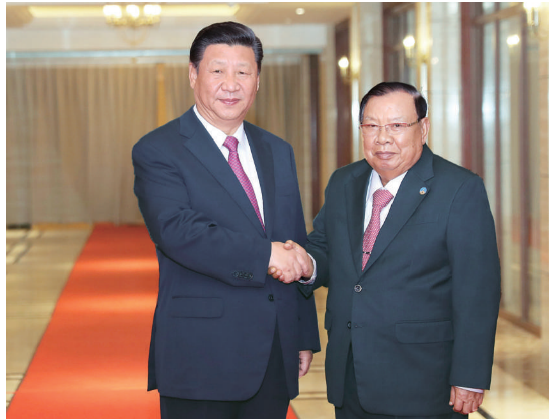
十一月十四日,中共中央总书记、国家主席习近平在万象下榻饭店再次会见老挝人民革命党中央委员会总书记、国家主席本扬。

本报万象11月14日电 记者关晋勇 刘威报道:中共中央总书记、国家主席习近平14日在万象下榻饭店再次会见老挝人民革命党中央委员会总书记、国家主席本扬。