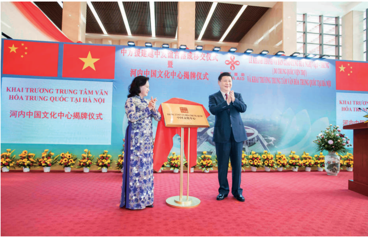
11月12日,中共中央总书记、国家主席习近平在河内出席越中友谊宫落成移交仪式暨河内中国文化中心揭牌仪式。这是习近平和越南国会主席阮氏金银共同为中国文化中心揭牌。

丁薛祥、刘鹤、杨洁篪等中方陪同人员,越共中央政治局委员、中央书记处书记、中央宣教部部长武文赏,国会副主席汪朱流,国会副主席、越中友好议员小组主席杜伯己,副总理武德儋等参加会见。