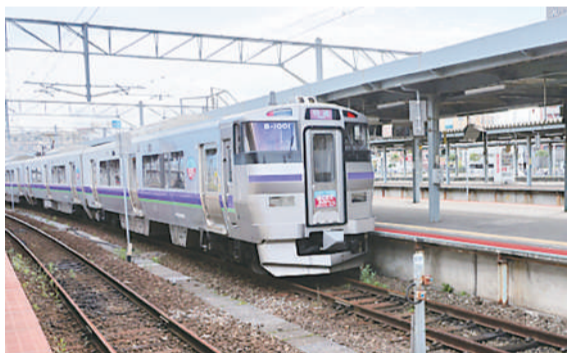
日本北海道JR列车。

选定去日本北海道旅行,有人说,在北海道出行主要靠JR,最好买本通票,3天到5天的都有。我们费了不少功夫,查到了JR的线路图和时刻表。