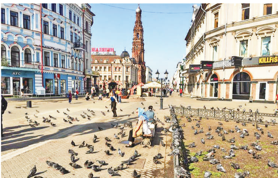
上图 喀山街头一角。

画里,少见高楼大厦,市中心建筑大多以灰色为基底,或红砖或灰墙的四五层楼房让人想起过去。斑驳的外墙配上楼前粗壮古朴的大树,倒也不显出衰败和破旧,反而充满了年代感,像在无声诉说着这个国家饱经风霜