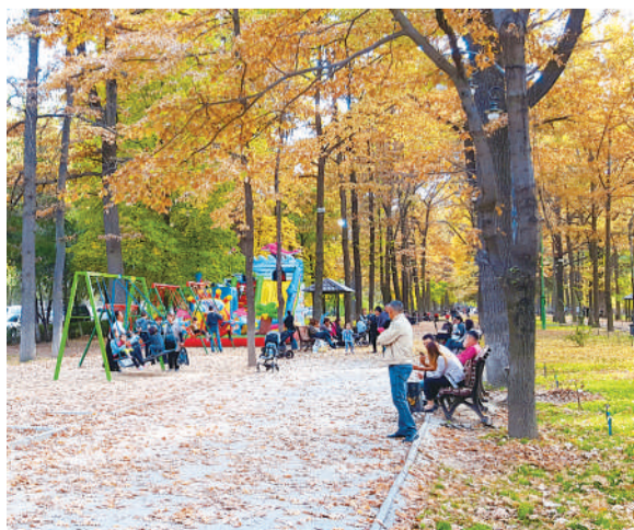
比什凯克市区街心公园里休闲的人们。

再看不远处的阿拉套广场,也是一片祥和安定,丝毫没有经历过冲突动乱的影子。广场中休闲玩耍的人们尽情享受美好的时光,暖阳更恣意的洒向宽敞的地面,融化了岁月里曾有过的阴霾,照得孩子们脸上都泛起了红晕。我看见孩童们欢快地奔跑,听见他们发出银铃般的笑声。他们跑着、笑着,完全融入了美景,仿佛为静美的城市秋韵图增添了生机与活力。