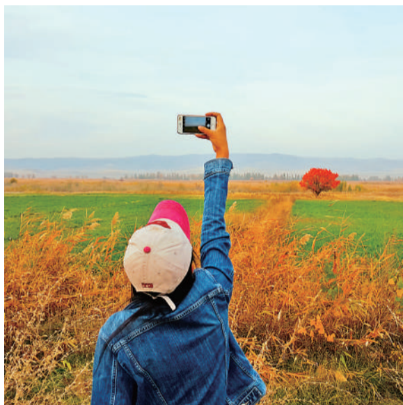
比什凯克市郊的秋天,吸引了过路的游客。

比勒陀利亚的市民们对蓝花楹怀有美好的情愫。对他们来说,蓝花楹是这座城市的象征,更是他们生活的一部分。比勒陀利亚被称为“蓝花楹之城”。每年10月中旬,在蓝花楹开得最繁盛的时候,比勒陀利亚总会举办一次大型长跑活动,数千名参与者沐浴在花海里,踏着一路上的紫花地毯奔跑。蓝花楹盛开时,又恰好是南非学校考试季临近的时候。比勒陀利亚大学的学生们甚至有一种“迷信”:蓝花楹花瓣掉头上,意味着幸运,一定能够通过考试。据说有的学生因此会在蓝花楹树下徘徊许久,等待幸运女神降临!