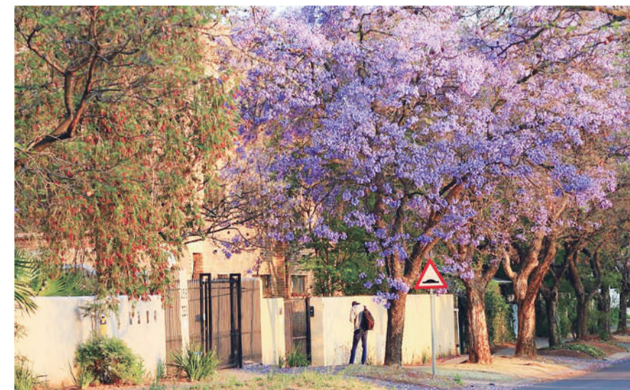
比勒陀利亚街头盛开的蓝花楹。