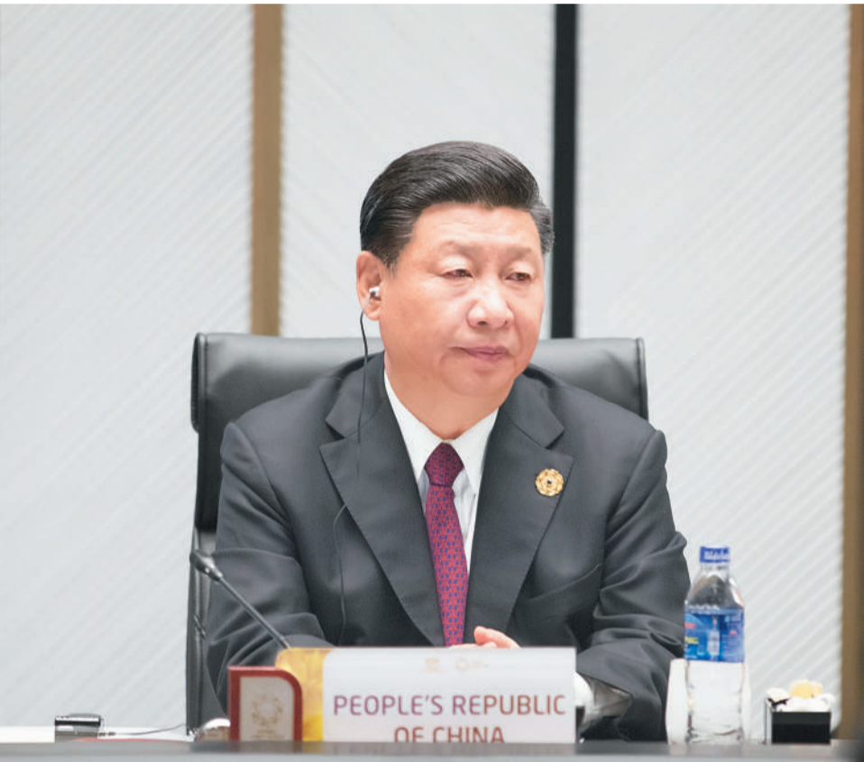
11月11日,亚太经合组织第二十五次领导人非正式会议在越南岘港举行。国家主席习近平出席并发表题为《携手谱写亚太合作共赢新篇章》的重要讲话。