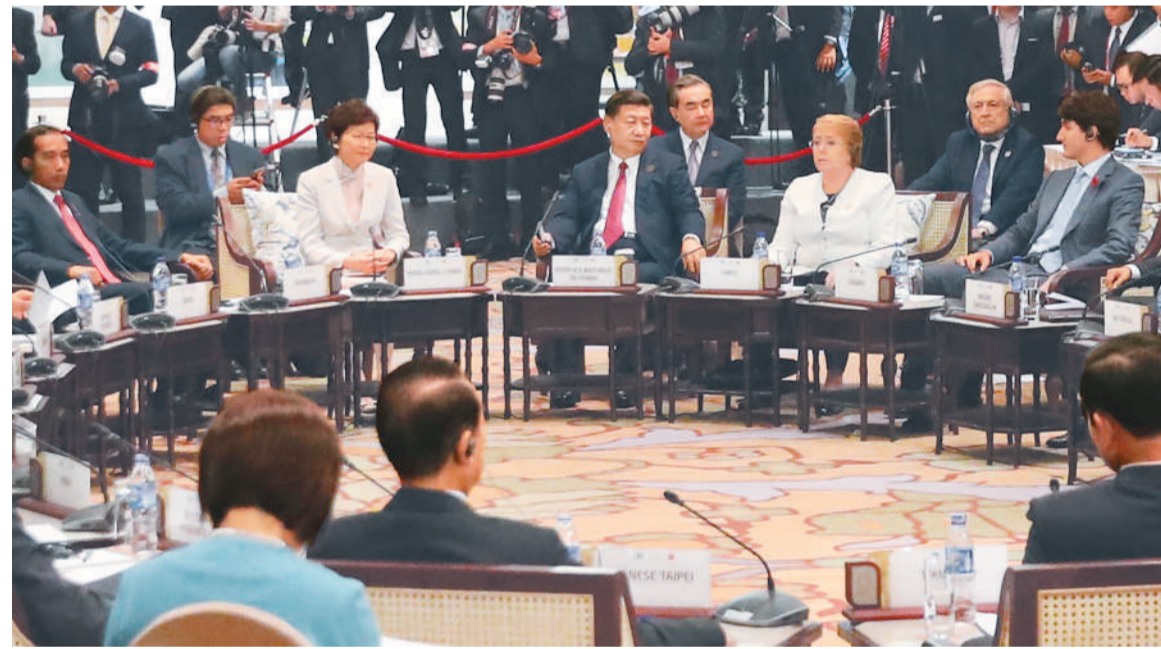
11月10日,国家主席习近平出席在越南岘港举行的亚太经合组织领导人与东盟领导人对话会。(详见二版)