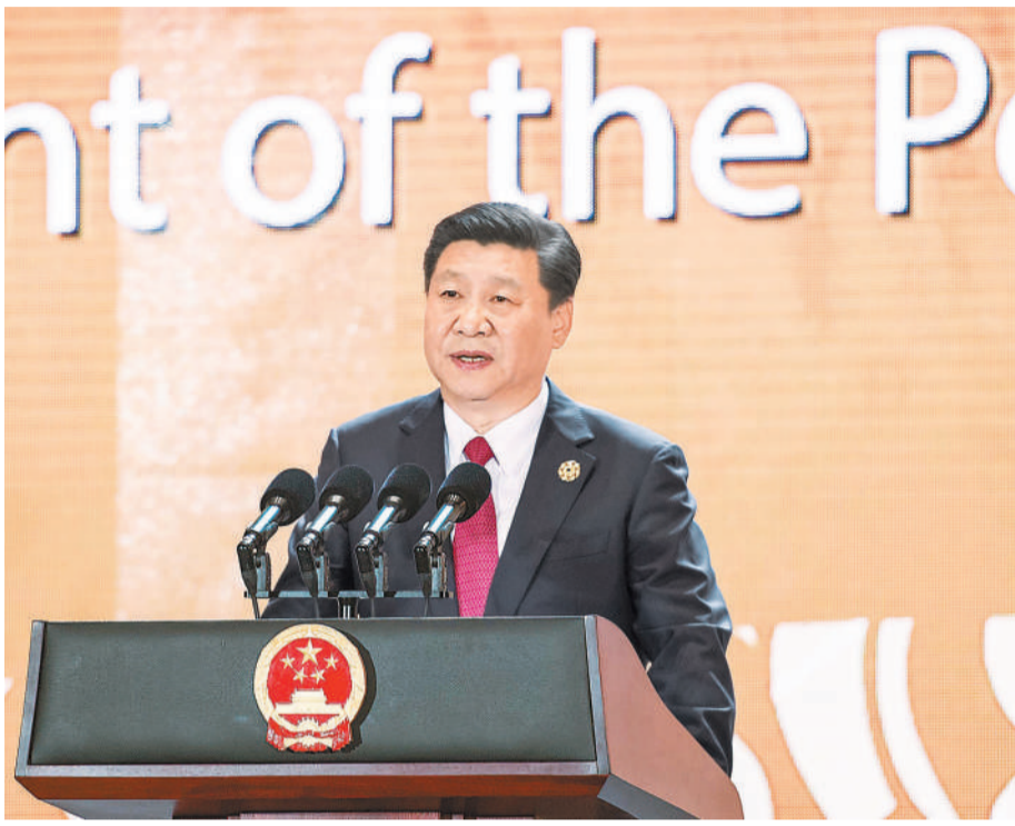
11月10日,国家主席习近平应邀出席在越南岘港举行的亚太经合组织工商领导人峰会并发表题为《抓住世界经济转型机遇 谋求亚太更大发展》的主旨演讲。

本报越南岘港11月10日电 记者赵青 田原 崔玮报道:国家主席习近平10日应邀出席在越南岘港举行的亚太经合组织工商领导人峰会并发表题为《抓住世界经济转型机遇 谋求亚太更大发展》的主旨演讲,强调世界正处在快速变化的历史进程之中,世界经济正在发生更深层次的变化。我们必须顺应大势,勇于担当,共同开辟亚太发展繁荣的光明未来。