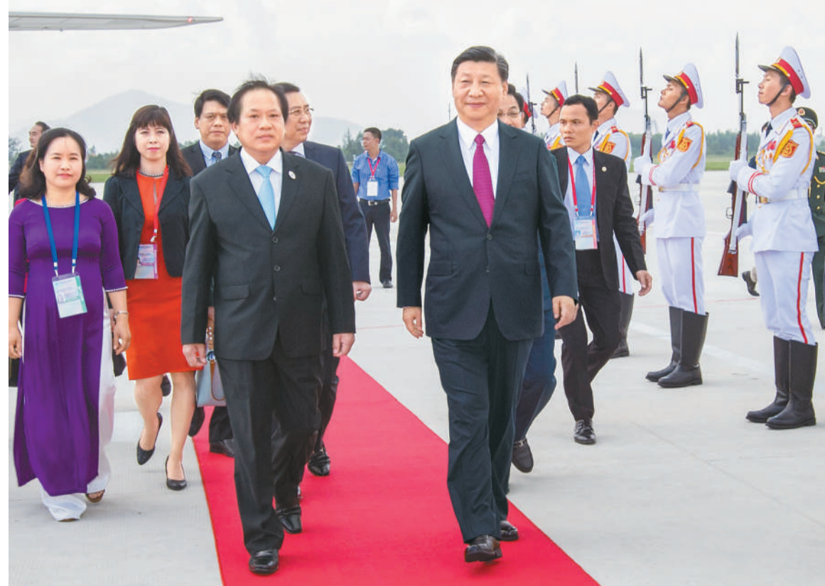
11月10日,中共中央总书记、国家主席习近平抵达越南岘港,出席亚太经合组织第二十五次领导人非正式会议并对越南社会主义共和国进行国事访问。习近平步出舱门,受到越南政府部长等高级官员热情迎接。(详见二版)