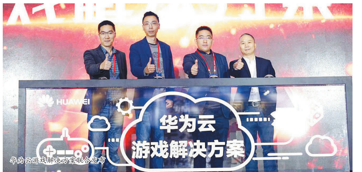
华为云游戏解决方案联合发布

成都易科士携手华为云，运用统一数据管理和分析服务，对教学、管理、技术服务、生活服务等校园信息数据进行收集、存储、传输和分析应用，推出一卡一库一网的新型智能校园一卡通方案，为广大学生、教职工的生活、学习和工作提供一站式便捷服务。