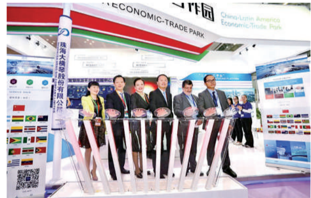
图为中拉企业法律服务中心珠海启动现场。

中拉企业法律服务中心由中银-力图-方氏（横琴）联营律师事务所开发和运营。该所是全国首家由中国大陆与香港、澳门三地律师事务所合伙设立的律师事务所，是“一国两制”下三地法律服务合作的创新。联营三方分别为北京市中银律师事务所、澳门力图律师事务所和香港方氏律师事务所。三地律师事务所强强联合，开创中国大陆和港澳法律服务的跨区域和跨法域合作，将为境内外企业及“一带一路”相关国家的企业提供便捷、高效的跨境、国际法律服务。该所多名操练中、英、西、葡语的律师还在中拉国际博览会现场为中拉企业提供免费的法律咨询。