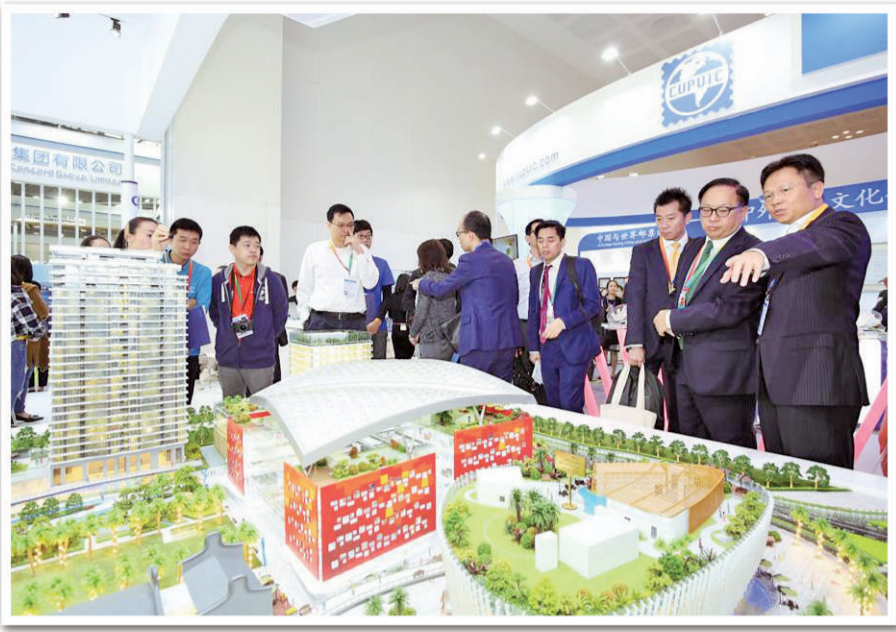
左图 中国—拉美国国际博览会上，与会代表参观横琴中拉经贸产业园展位。