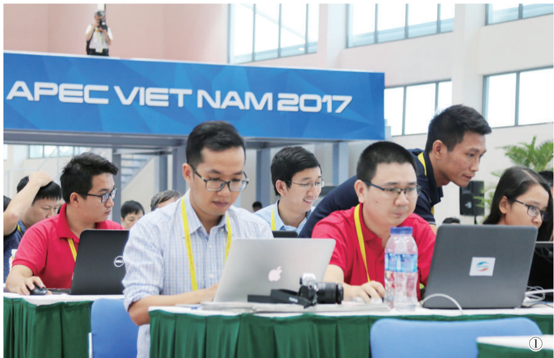
图① 本届APEC会议吸引了全球超过2600名记者前来采访报道。在新闻中心,记者们已经开始忙碌。