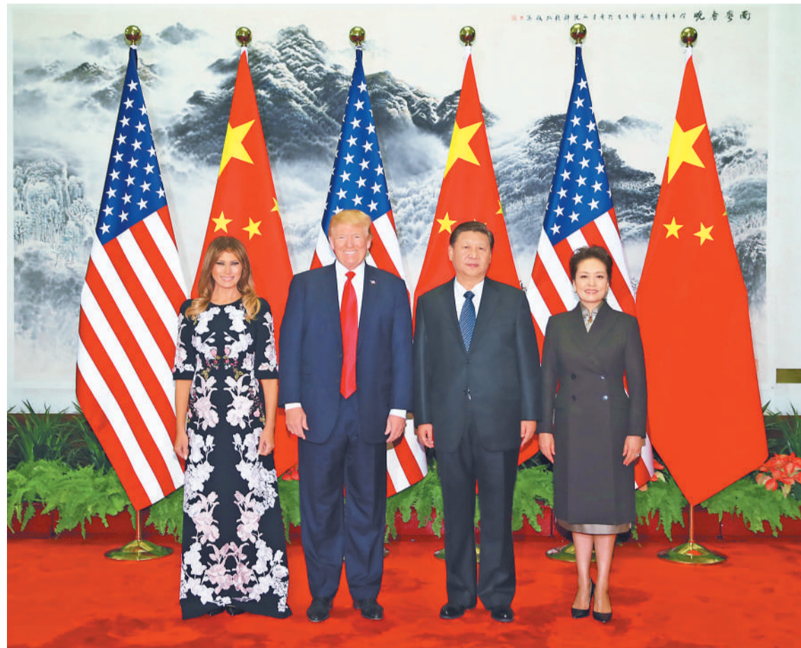
11月9日,国家主席习近平在北京人民大会堂东门外广场举行欢迎仪式,欢迎美利坚合众国总统唐纳德·特朗普对中国进行国事访问。这是习近平和夫人彭丽媛在人民大会堂同特朗普夫妇合影。