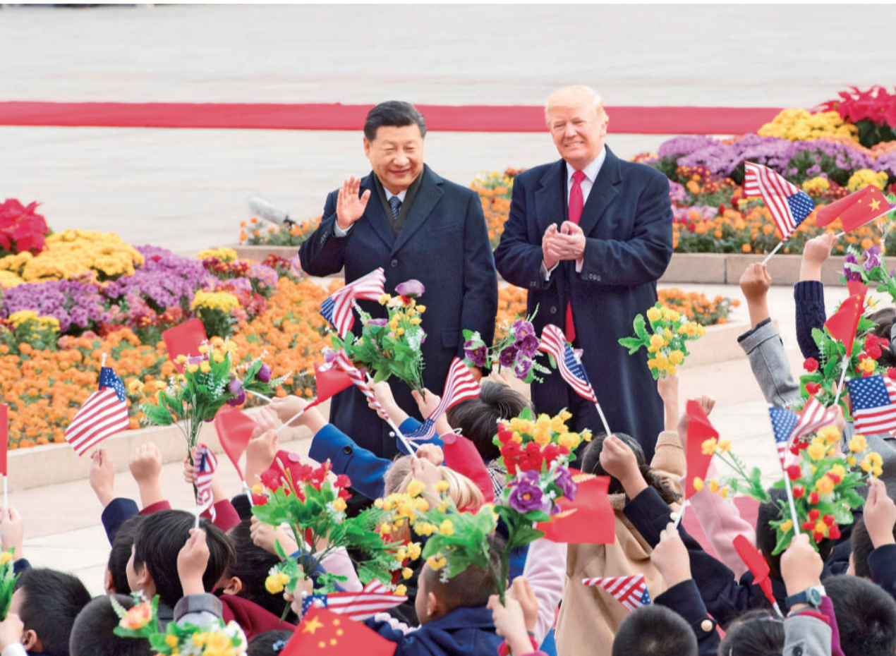
11月9日,国家主席习近平在北京人民大会堂东门外广场举行欢迎仪式,欢迎美利坚合众国总统唐纳德·特朗普对中国进行国事访问。

中美元首一致同意继续发挥元首外交对两国关系的战略引领作用 推动中美关系得到更大发展