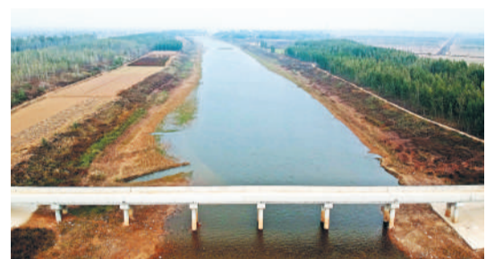
△作为雄安新区生态水源保障项目的引黄入冀补淀工程主体工程基本完工。

●河北省日前印发《关于建立粮食生产功能区和重要农产品生产保护区的实施意见》，提出科学合理划定粮食生产功能区和重要农产品生产保护区，争取用3年时间完成国家分配下达河北省的4500万亩粮食生产功能区和300万亩重要农产品生产保护区划定任务。力争用5年时间基本完成“两区”建设任务。