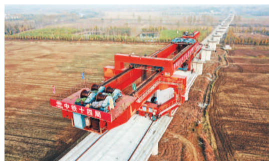
△鲁南高铁箱梁架设全面展开。鲁南高铁东起山东日照，向西经临沂、曲阜、济宁、菏泽，与河南省郑徐客运专线在菏泽南站接轨。

●山东印发《离岸创新人才引进使用支持办法（试行）》，鼓励省内企业、高校、社会组织等在国（境）外聘请外籍高层次人才。对于上述机构在国（境）外建立研发基地、开放实验室、科技孵化器、技术转移中心等离岸创新创业基地的，将视人才引进数量，给予300万元至500万元的奖励。