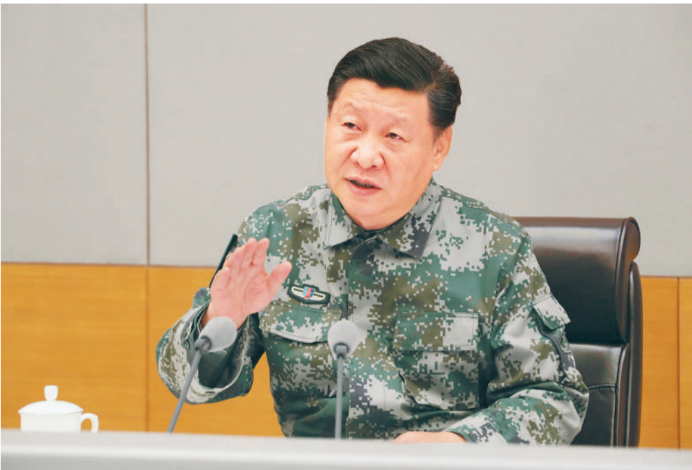
11月3日,中共中央总书记、国家主席、中央军委主席、军委联指总指挥习近平视察军委联合作战指挥中心,表明新一届军委贯彻落实党的十九大精神、推动全军各项工作向能打仗、打胜仗聚焦的鲜明态度。这是习近平听取全军练兵备战工作汇报后发表重要讲话。