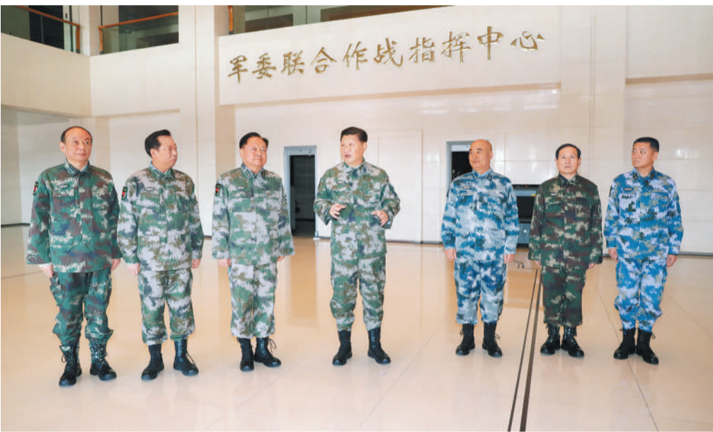
这是习近平带领军委一班人研究军委联指中心建设情况。