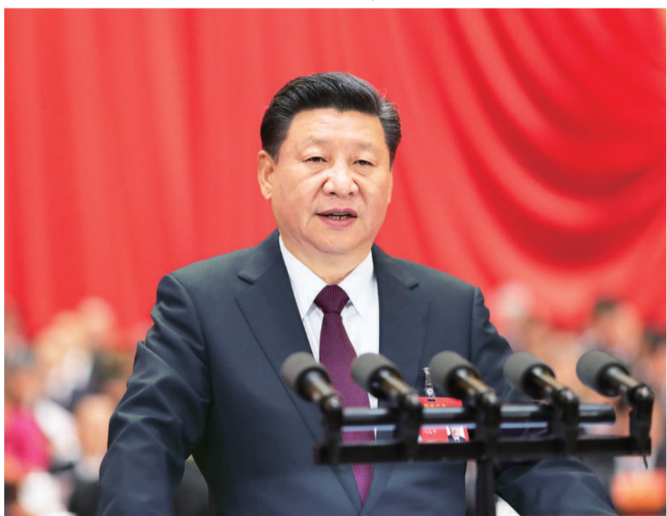
10月18日,习近平在中国共产党第十九次全国代表大会上作报告。

为贯彻十八大精神,党中央召开七次全会,分别就政府机构改革和职能转变、全面深化改革、全面推进依法治国、制定“十三五”规划、全面从严治党等重大问题作出决定和部署。五年来,我们统筹推进“五位一体”总体布局、协调推进“四个全面”战略布局,“十