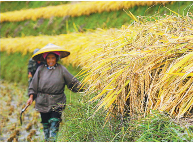
10月19日,农民在广西龙胜族自治县龙脊梯田里收获稻谷。