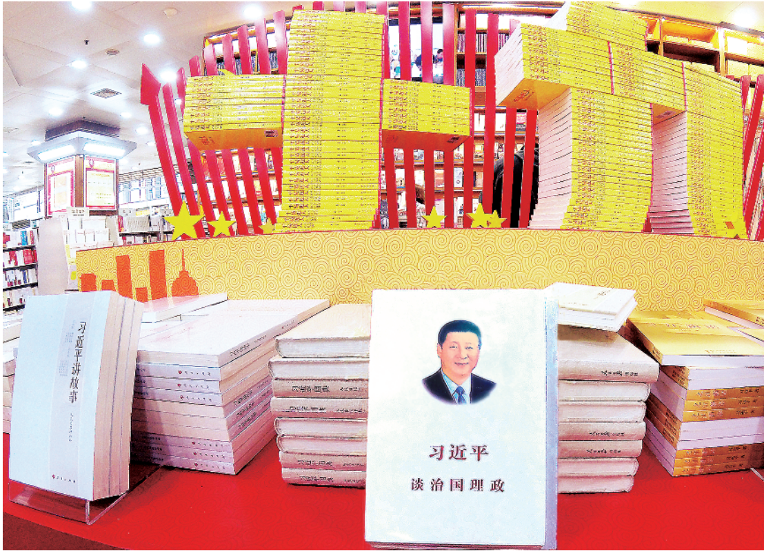
10月15日,北京王府井书店摆放的习近平总书记系列重要讲话学习读物。

要维持出口高增长已不大可能。2015年10月,党的十八届五中全会及时作出重大决策部署。全会强调,破解发展难题,厚植发展优势,必须牢固树立并切实贯彻创新、协调、绿色、开放、共享的发展理念。