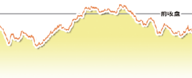
10月17日上证综指走势图