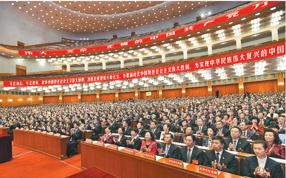
10月17日,中国共产党第十九次全国代表大会在北京人民大会堂举行预备会议。习近平同志主持会议。新华社记者 李学仁摄

办法(草案),提交各代表团酝酿。会议还通过了列席和来宾事项。中央决定,邀请党内有关负责同志和部分党外人士列席大会。列席大会的有:不是十九大代表的十八届中央委员会委员、候补委员和中央纪律检查委员会委员,不是十九大代表、特邀代表的原中央顾问委员会委员,以及其他有关同志,共405人。作为来宾列席大会开幕会和闭幕会的有:现任和曾