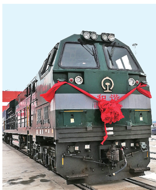
▲10月13日，长春国际港口通暨中欧班列(长春—汉堡)首发活动在长春新区举行。