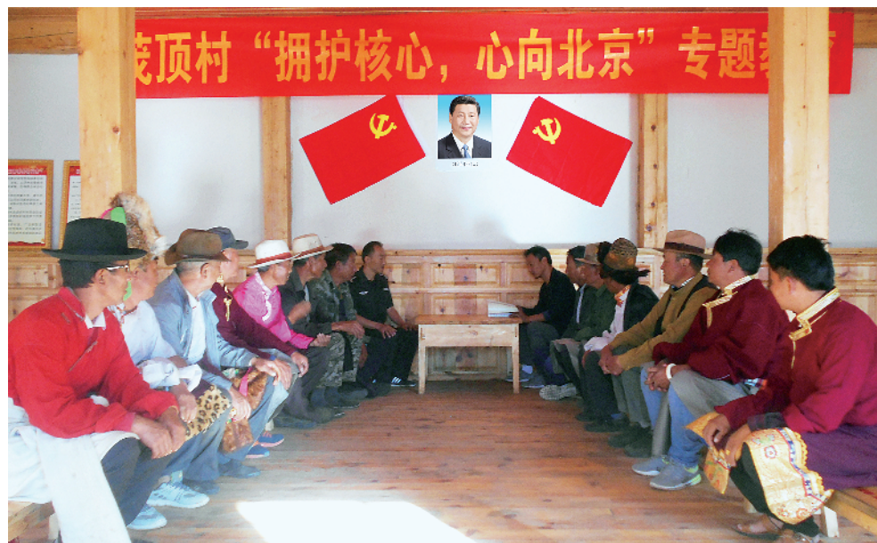
云南省迪庆藏族自治州德钦县羊拉乡茨顶村组织党员干部认真学习习近平总书记系列重要讲话精神。