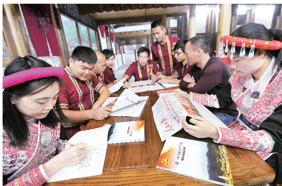
各地区各部门认真学习党的十八大六中全会精神，纷纷表示：要牢固树立“四个意识”，更加紧密地团结在以习近平同志为核心的党中央周围，始终在思想上、政治上、组织上、行动上拥戴核心、信赖核心、忠诚核心、坚决捍卫核心。图为福建畲族村学习六中全会精神。

以习近平同志为核心的党中央牢牢把握全面从严治党这一鲜明主题，统揽伟大斗争、伟大工程、伟大事业、伟大梦想，坚持打铁还需自身硬，身体力行、率先垂范，着力抓思想从严、管党从严、执纪从严、治吏从严、作风从严、反腐从严，推动党的建设取得重大历史性成就，党内政治生活气象更新，全党理想信念更加坚定、党性更加坚强，党自我净化、自我完善、自我革新、自我提高能力显著提高，赢得了全党全军全国各族人民衷心拥护，开辟了管党治党新境界，为党和国家各项事业发展提供了坚强政治保证