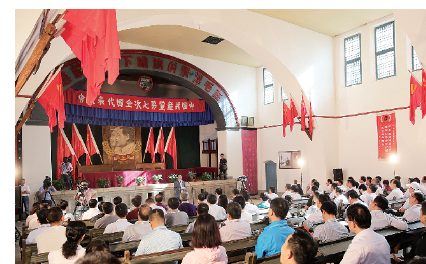
2016年9月，中国延安干部学院厅局级干部加强党性修养专题培训班学员在延安杨家岭中共七大遗址开展现场教学。