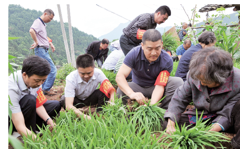
贯彻落实抓党建促脱贫攻坚工作会议精神，发展壮大贫困村“空壳村”集体经济，努力提高贫困群众生活水平。图为四川省广元市苍溪县机关党员深入脱贫攻坚一线为民服务。