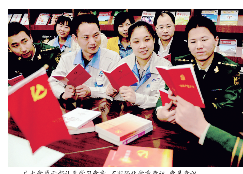
广大党员干部认真学习党章，不断强化党性意识、党员意识。