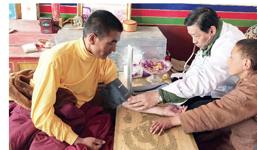
突出基层导向和实践导向，优化干部成长路径，平级择优选拔援藏、援疆、援青干部。图为“组团式”援藏医生为西藏自治区阿里地区噶尔县群众进行义诊。