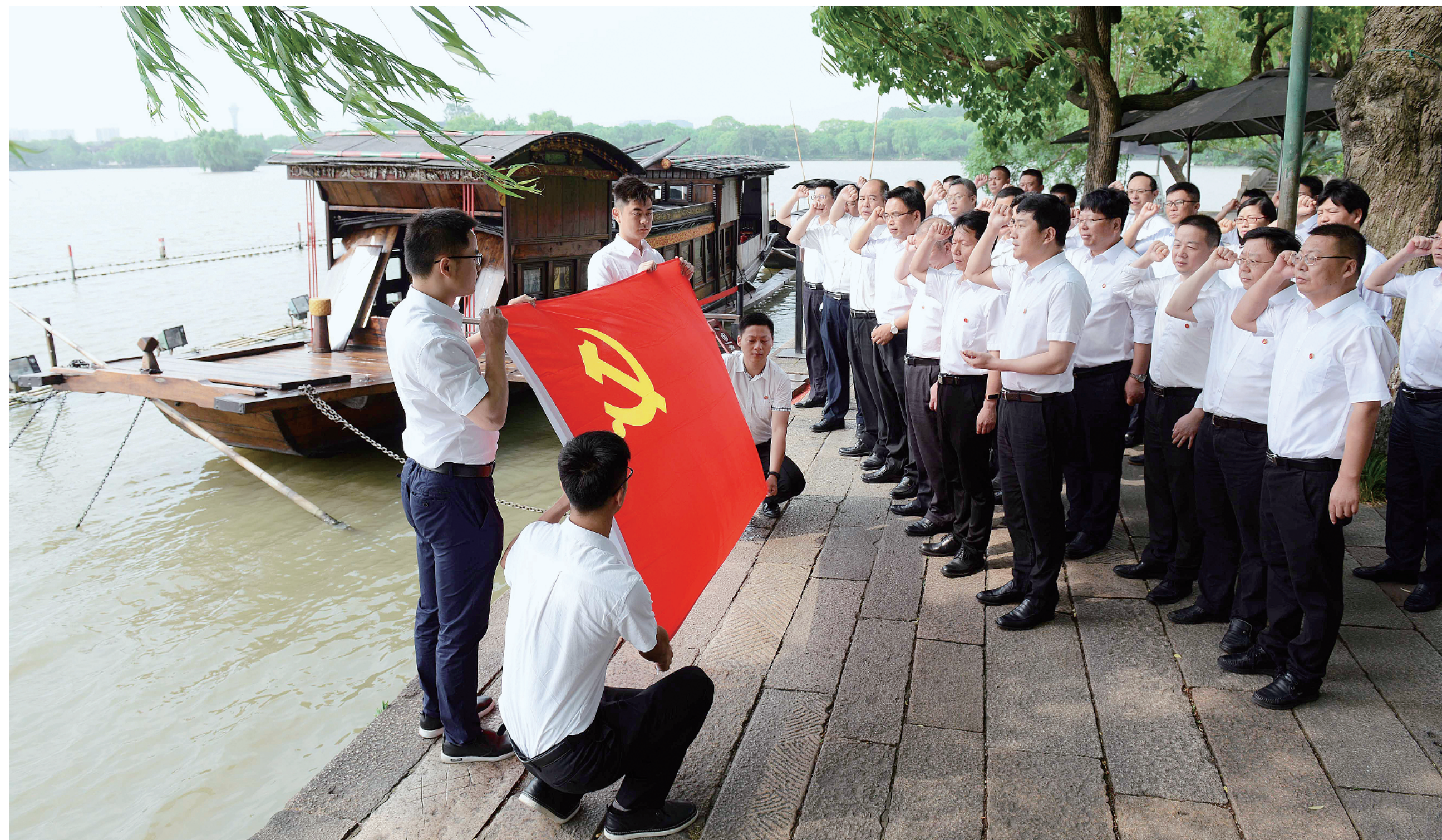
坚持高标准与守底线相统一，教育引导党员干部坚定理想信念，不断提高党性修养和政治觉悟；以党的纪律为尺子，强化刚性约束。图为浙江省嘉兴市党员干部在南湖红船前重温入党誓词。