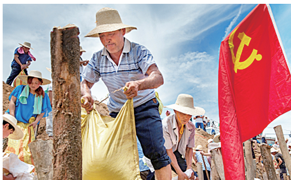
“平常时候看得出来，关键时刻冲得上去”。2016年7月，湖北遭遇罕见汛情灾害，广大党员干部奋战在抗洪抢险第一线。