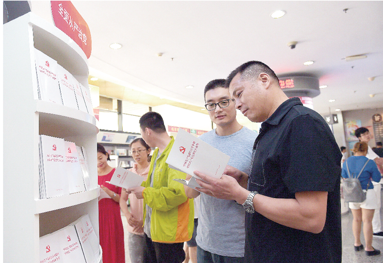
坚持纪严于法、纪在法前，实现纪法分开。2015年10月，中央政治局审议通过《中国共产党廉洁自律准则》和《中国共产党纪律处分条例》。图为读者在选购准则和条例单行本，该书目前已发行2100万册。