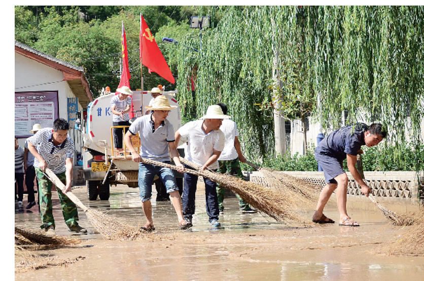
2015年4月至2016年2月，在县处级以上领导干部中开展“三严三实”专题教育。图为甘肃省陇南市康县组织县乡机关领导干部走出机关，参与“美丽乡村”建设。