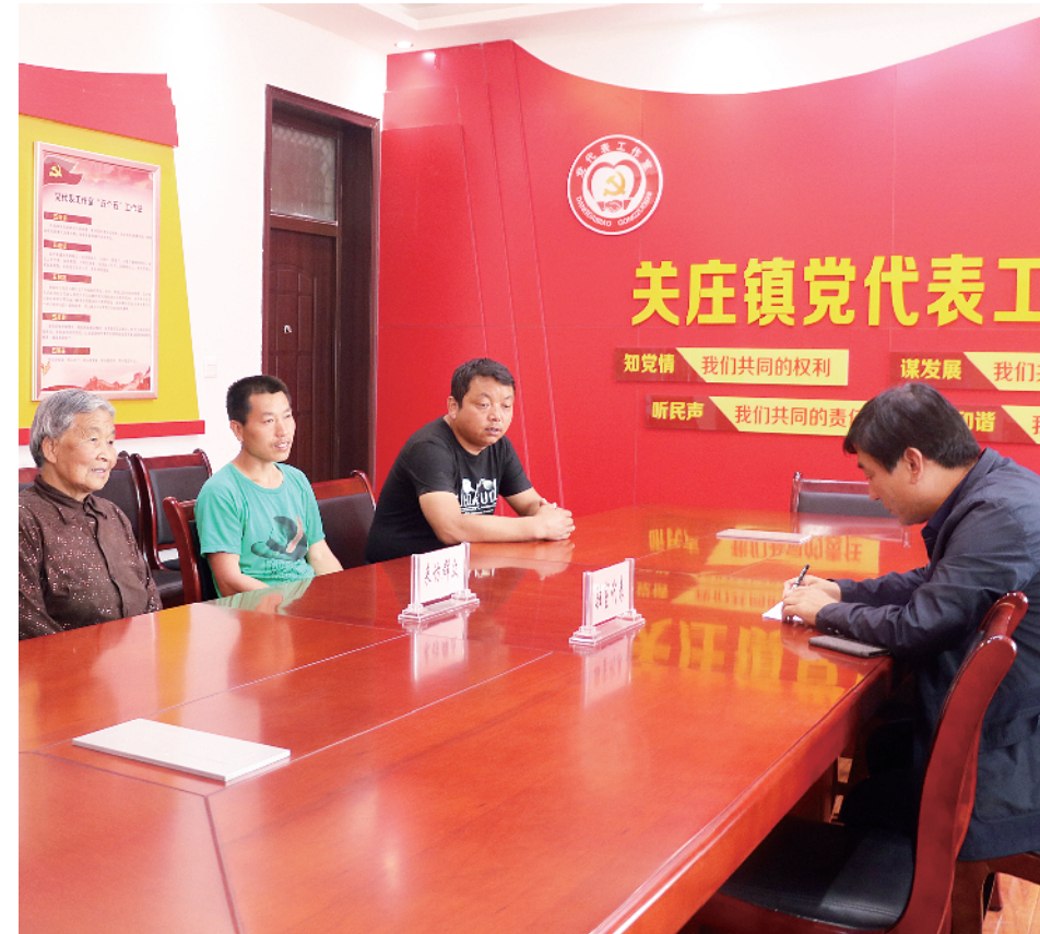
党代会闭会期间，代表在民主决策、民主监督、联系党员群众等方面积极发挥作用。图为陕西省铜川市党代会代表到代表工作室接待党员群众。