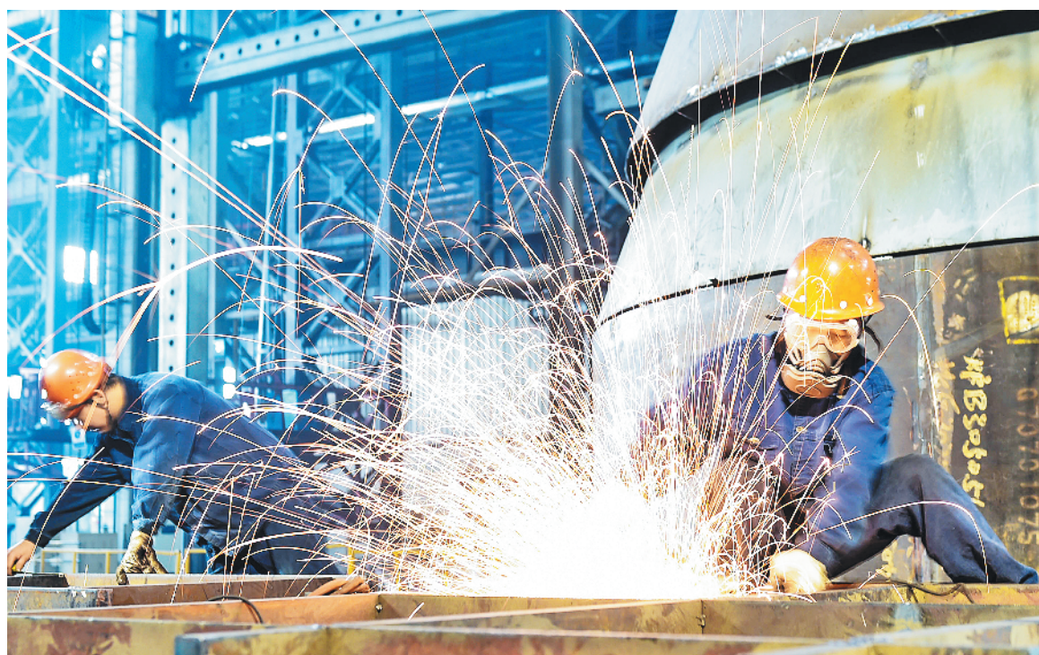
10月1日，在河南省洛阳市中信重工铆焊车间，工人在焊接矿用磨粉筒体的加急配件。

段、景区沿线等重点路段的管控，实行定人定岗，最大限度地预防和减少道路交通事故，确保车辆有序通行。贵州雷山县西江交警中队还提前部署，细化措施，在较容易造成拥堵的景区核心区路段实行单线行驶，切实缓解道路通行压力。