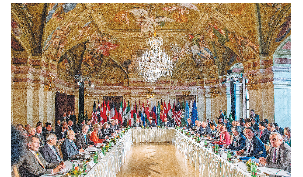
中国积极参与叙利亚问题政治解决，出席历次叙利亚国际支持小组外长会。图为2016年5月，在奥地利维也纳举行的各方高级外交代表会议。