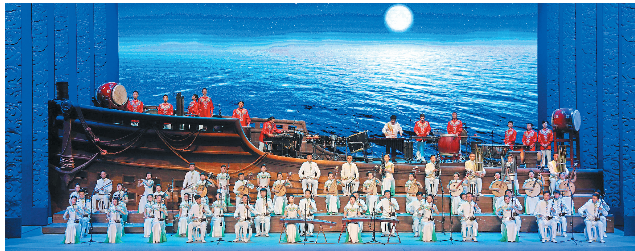
“一带一路”引领国际合作新实践。2017年5月，在“一带一路”国际合作高峰论坛上，中外嘉宾共赏《千年之约》文艺晚会。