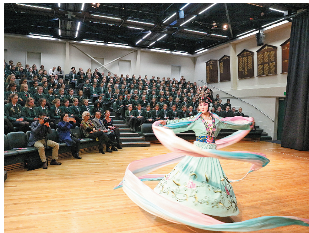
“2017年中国文化周”走进新西兰校园。中国京剧演员在惠灵顿塞缪尔·马斯丹女校表演。

以习近平同志为核心的党中央牢牢把握坚持和平发展、促进民族复兴这条主线，统筹国内国际两个大局，统筹发展安全两件大事，坚决捍卫国家主权、安全和发展利益。以大格局、大气魄、大手笔谱写了中国特色大国外交的新篇章，推动构建人类命运共同体。大幅提升了我国国际地位和影响，营造了我国发展的和平国际环境和良好周边环境，为人类和平与发展事业作出新的重大贡献。