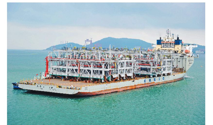
2016年6月，装载亚马尔液化天然气项目两个大型液化天然气模块的船只驶离青岛港，启程前往俄罗斯。