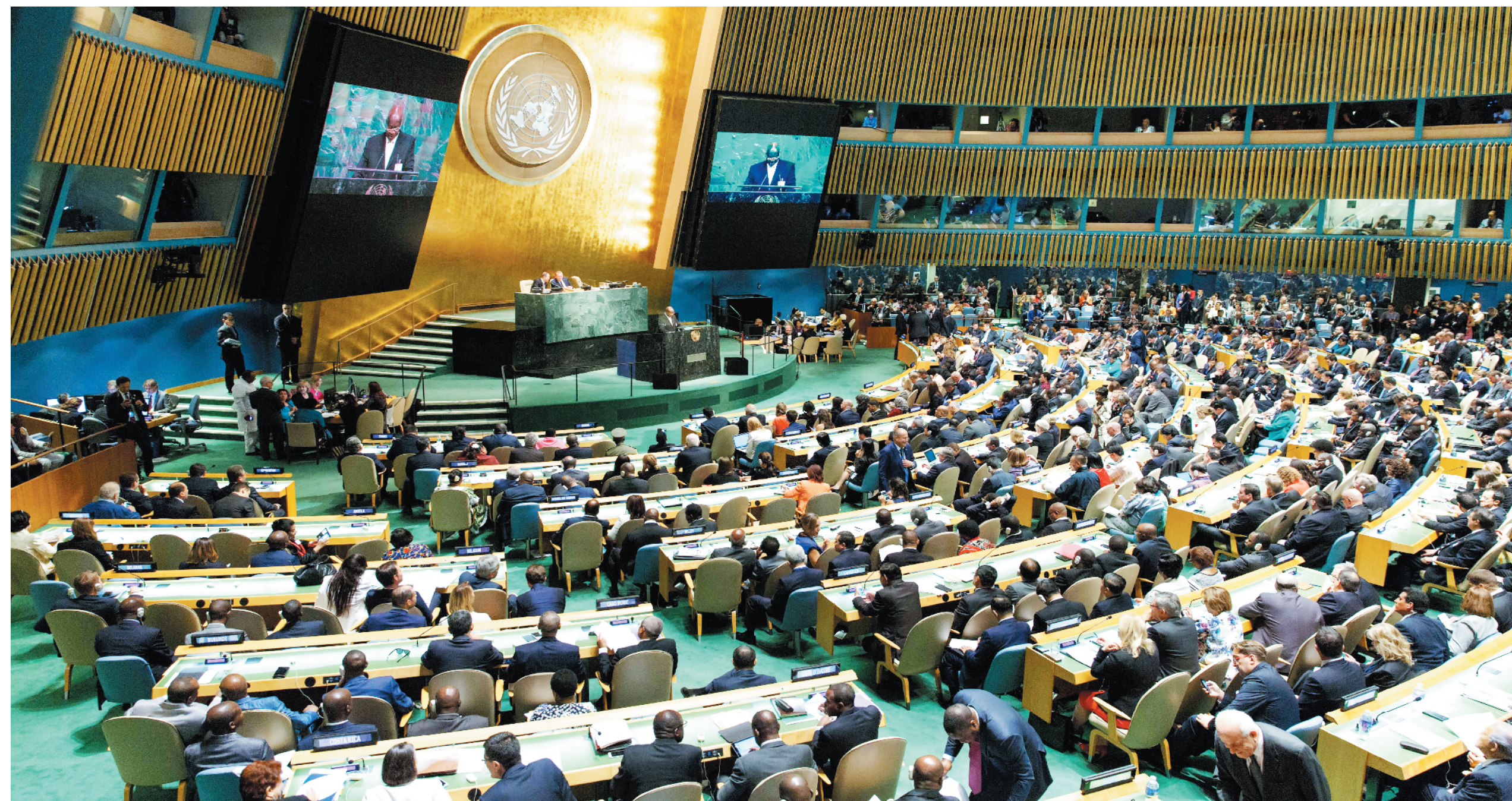
2015年9月26日，国家主席习近平在联合国发展峰会上发表题为《谋共同永续发展 做合作共赢伙伴》的重要讲话，全面阐述新发展观。图为2015年9月25日联合国发展峰会开幕式现场。