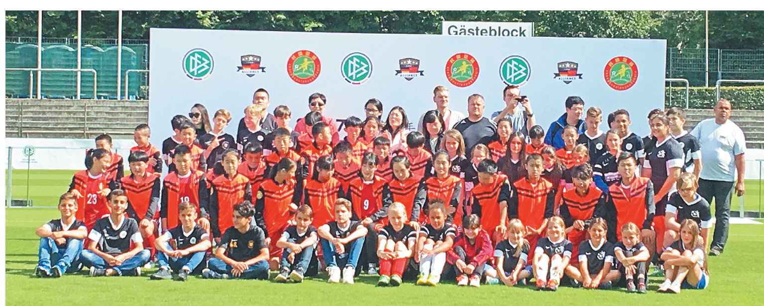
2017年7月，中德青少年足球队友谊赛前两国小球员合影。