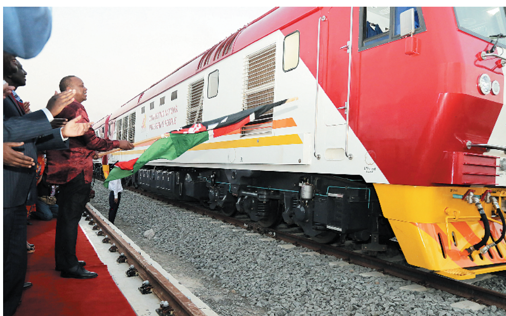
2017年5月，由中方建设的肯尼亚蒙内铁路正式通车。