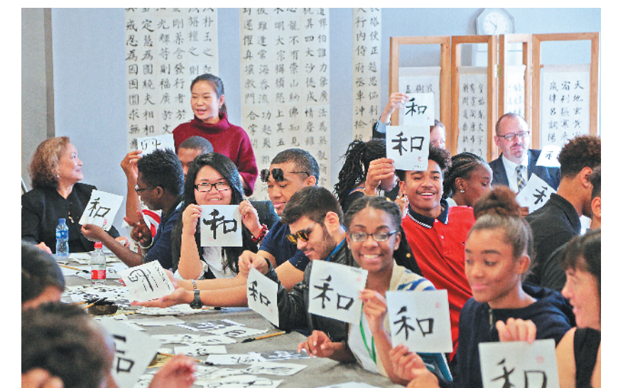
国之交在于民相亲。图为美国林肯中学学生展示书法作品。