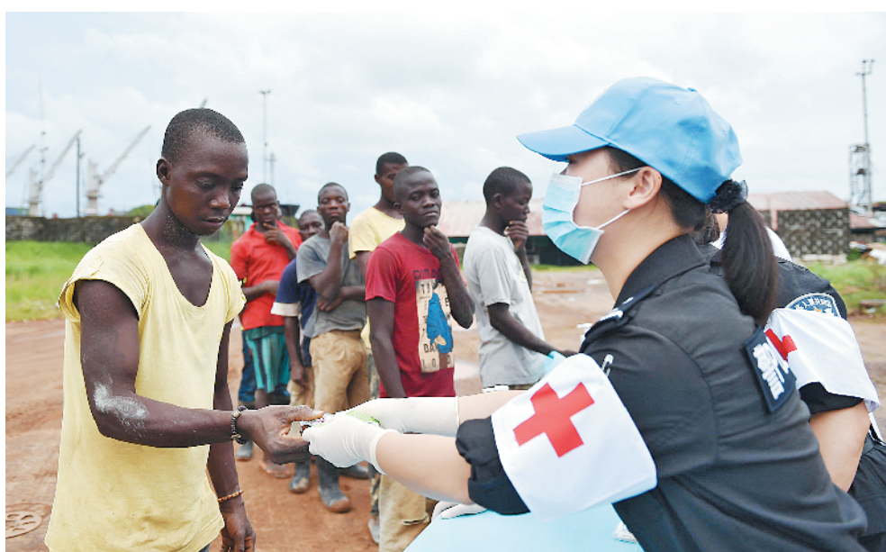
中国第四支赴利比亚维和警察防暴队一级医院的医护人员深入蒙罗维亚自由港区，开展义诊。