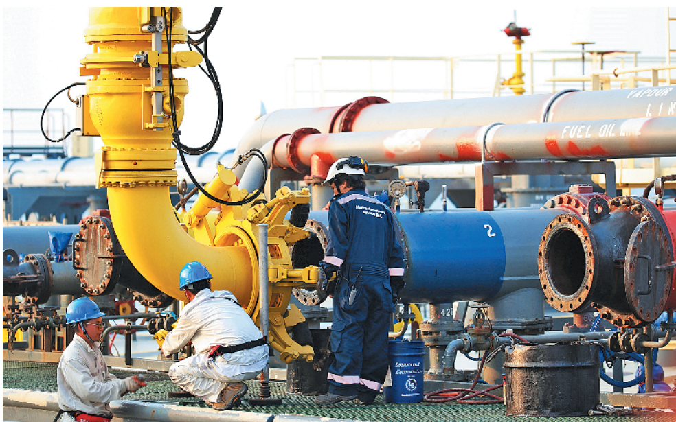
2017年4月，缅甸马德岛港工作人员对接卸油臂与油轮原油管口，中缅油气管道工程正式运行。