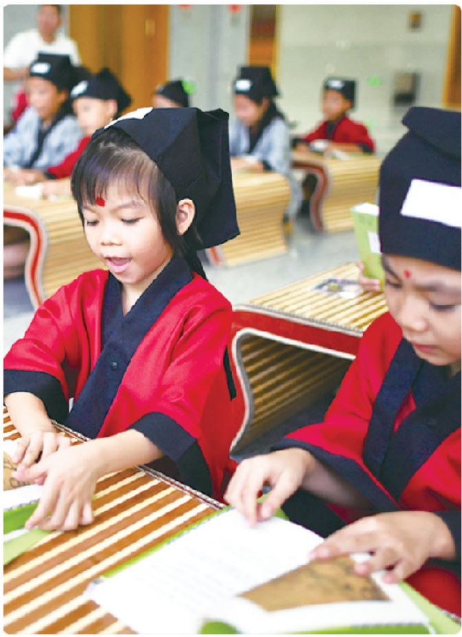
图为孩子们在上国学课。 近日，不少孩子来到海南省博物馆，学习中国传统礼仪，体验投壶、解九连环等古代娱乐活动，丰富暑假生活。

一个国家、一个民族的强盛，总是以文化兴盛为支撑的。党的十八大以来，在以习近平同志为核心的党中央领导下，各地区各部门全面推进文化体制改革，积极培育和践行社会主义核心价值观，现代公共文化服务体系初步形成，公共文化服务网络更加完善，文化产业规模不断扩大，文物保护状况明显改善。5年来，文化产业对国民经济贡献持续加大，文化自信显著增强，为稳步推进文化强国建设、实现全面建成小康社会目标提供了有力支撑。