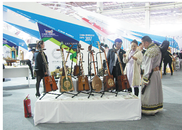
参展客商在交流马头琴制作工艺。