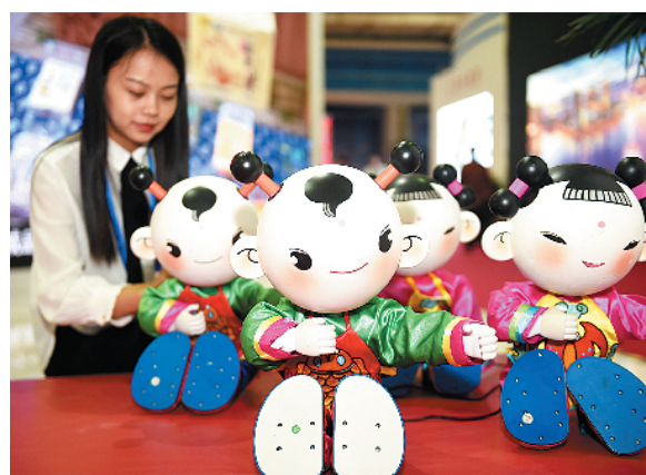
中蒙博览会上中国文化产品展台。