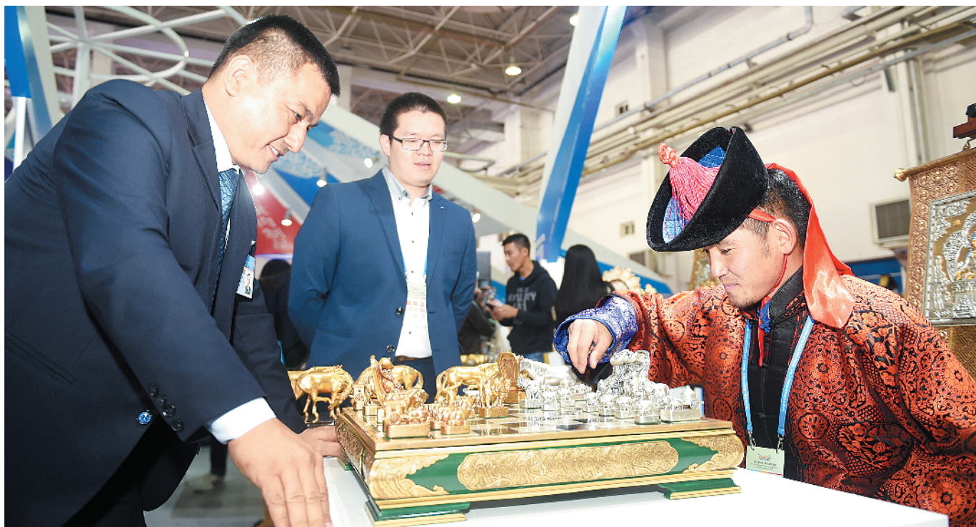
9月26日，参展人员在第二届中国—蒙古国博览会上对弈。

本届博览会以“建设中蒙俄经济走廊，面向全球合作共赢”为主题，围绕政策沟通、设施联通、贸易畅通、资金融通、民心相通，就中蒙俄共同关心、关注的重点领域展开交流合作。博览会吸引了30多个国家的1500多家企业参加展览展示