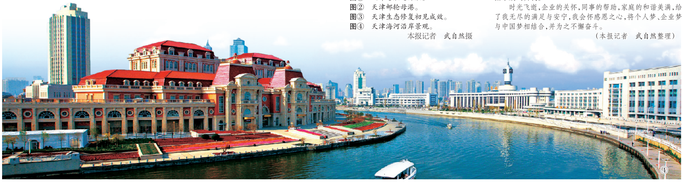
图① 天津港航道开航。 图② 天津邮轮母港。 图③ 天津生态修复初见成效。 图④ 天津海河沿岸景观。

从政府的系列扶持政策出台,到一批企业做强做大;从政府创新服务模式,到“三女齐嫁”放开民间准入;从政府和社会资本合作,到鼓励民营企业“走出去”;从加强人才队伍建设,到改善金融服务……通过多年聚力发展,如今天津民营企业保持了良好的发展态势,已安置就业人员达500多万人,民间投资占天津市投资比重达65.3%,天津各类企业齐头并进,千帆竞逐,呈现出和谐共生的景象。