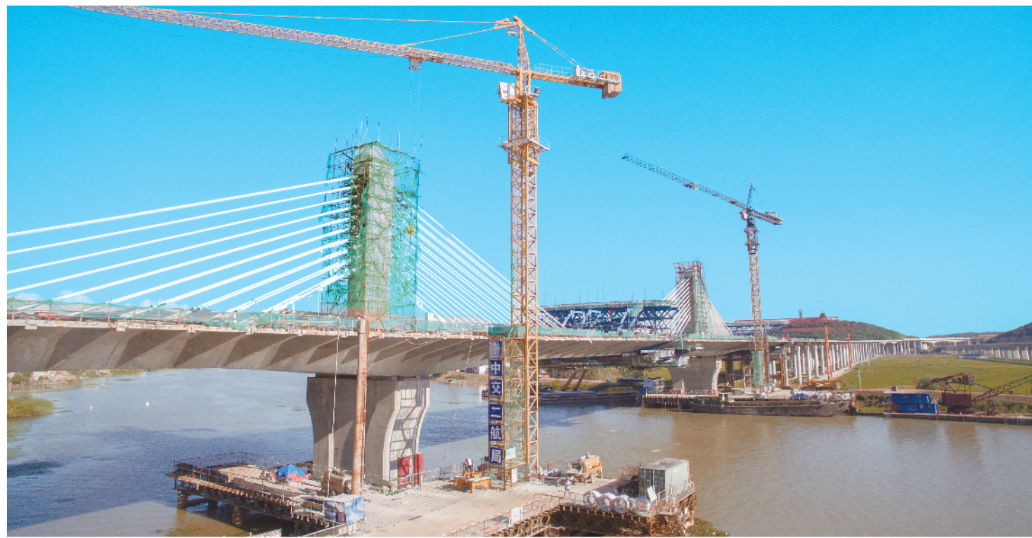
9月21日,安徽巢湖至无为高速公路关键节点工程——裕溪河特大桥顺利实现合龙,标志着北沿江高速巢无段全线贯通。