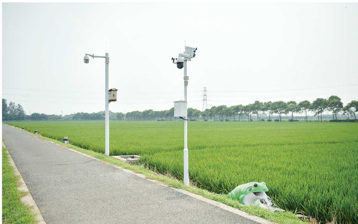
无锡市太湖米业有限公司的水稻智能灌溉示范园。

近年来，党中央、国务院对加快推进农业供给侧结构性改革作出了一系列重要部署，银行业积极响应、顺势而为。然而，如何盘活农村土地资源、缓解农民融资难、解决个体电商授信难，以信贷助力产业发展等问题，一直困扰农业产业转型升级。为推动农业农村发展闯关过坎，实现发展动能提升，不少地方引来金融活水助力农业转型发展。近日，记者来到江苏无锡、南通、泰州、宿迁和徐州等地市，对江苏银行业助力农业供给侧结构性改革开展调查。