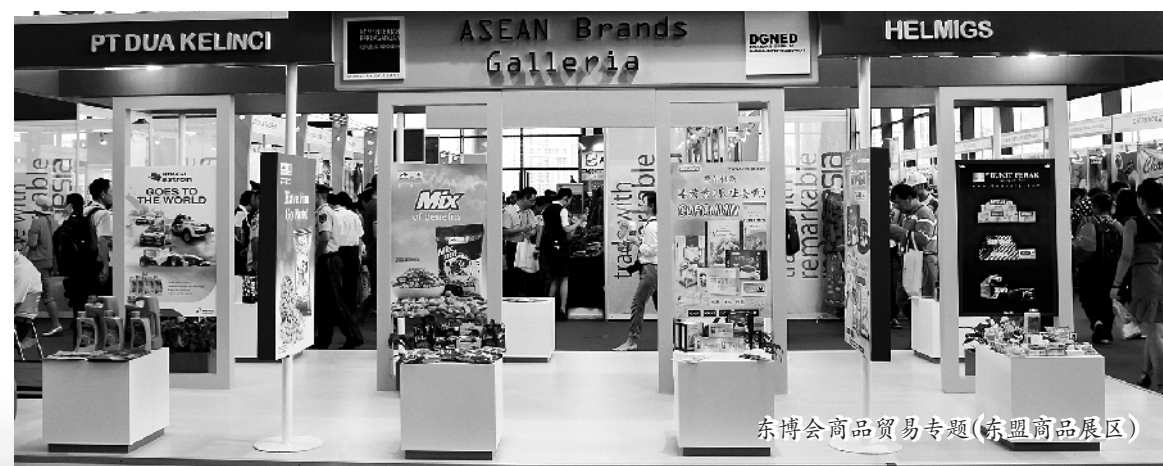
东博会商品贸易专题(东盟商品展区)