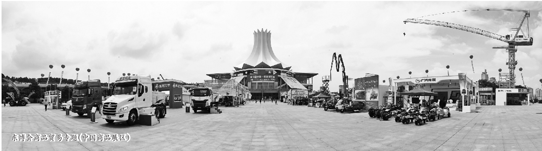
东博会商品贸易专题(中国商品展区)