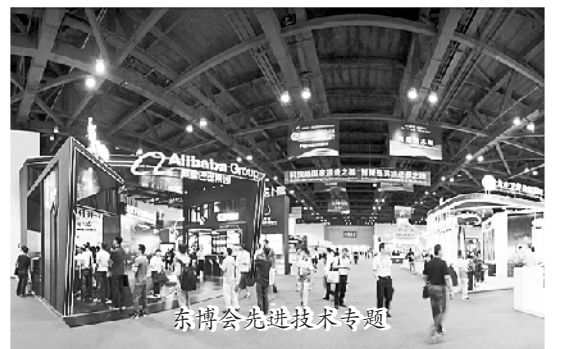
东博会先进技术专题