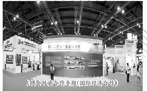
东博会投资合作专题(国际经济合作)

13年来，东博会共举办177个会议论坛，涵盖40多个领域，实现了部长级磋商以及政商代表、专家学者、社会各界知名人士之间的对话沟通，使各方凝聚共识。此外，东博会还促成建立起多领域合作机制，带动了“中国—东盟信息港、中国—东盟港口城市合作网络、中国—东盟技术转移中心、中国—东盟企业家联合会、中国—东盟青年联谊会、中国—东盟教育培训中心”等重大项目落地，夯实了中国—东盟合作的“南宁渠道”，推动21世纪海上丝绸之路在各领域的落实。