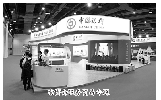
东博会服务贸易专题