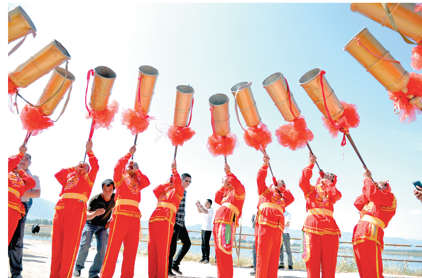
9月8日,山西广灵县壶流河湿地,当地民众在表演广灵大鼓。当日,首届“2017中国广灵湿地文化节”开幕,文化节以“塞上水城,域美广灵”为主题,旨在推介广灵县“北方水城、康养胜地、剪纸之乡”三张名片,打造大同旅游中心集散地和京津冀旅游度假承接地。