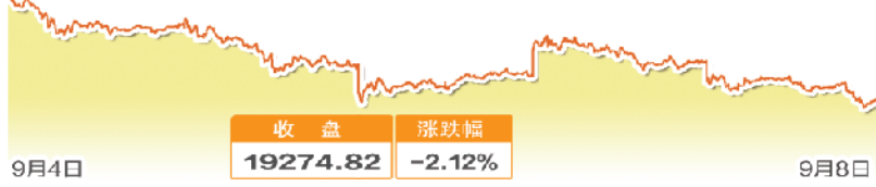
日经225指数一周走势图