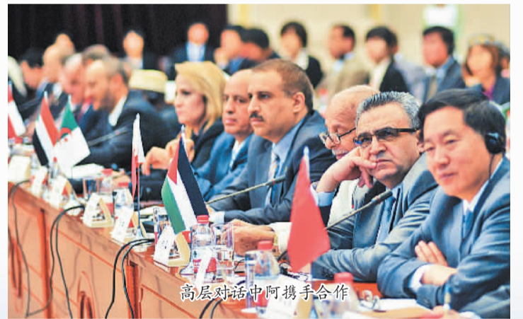
高层对话中阿携手合作

1、2016年宁夏实现进出口总额235亿元，近5年平均增速达到16.8%；合同利用外资2.5亿美元，增长36%，5年平均增速达到41%；对外直接投资9.5亿美元，5年平均增速达到135%。