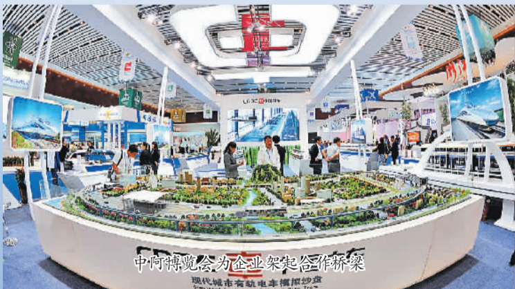
中阿博览会为企业架起合作桥梁