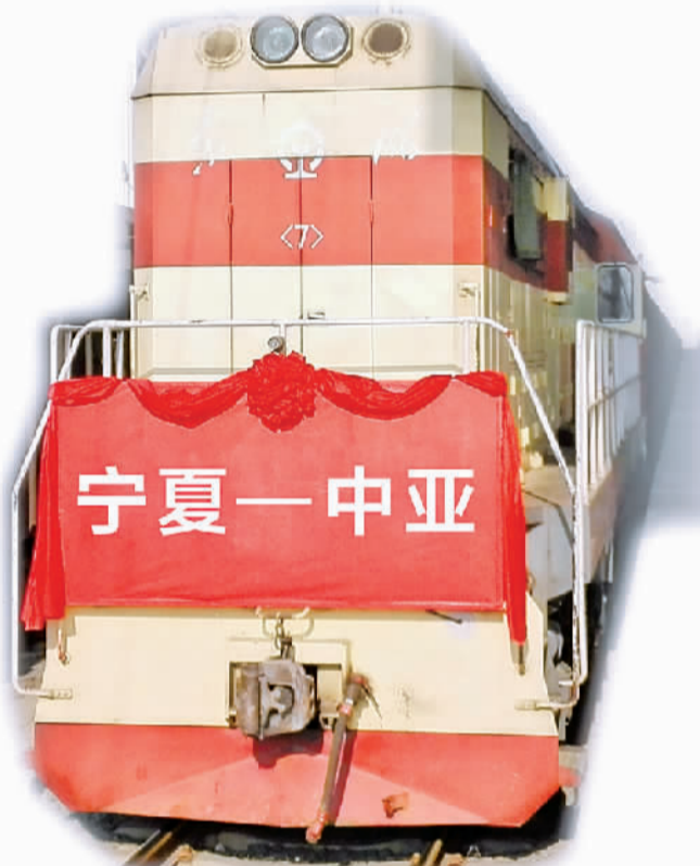
宁夏开通至中亚货运班列

展览方面，将举办中国高铁技术成就专题展和宁夏高铁建设展。中国高铁技术成就专题展由中国铁路总公司联合中国中铁股份有限公司、中国交通建设股份有限公司、中国电力建设集团有限公司、中国铁建股份有限公司、中国铁路通信信号集团公司、中国中车股份有限公司6家央企共同举办，将全面展示近年来中国铁路，特别是高速铁路在工程建设、装备制造、运营管理等方面最新创新成果，宣传中国铁路国际交流与合作成果，助力中国与阿拉伯和其他地区国家在轨道交通领域的合作共赢。