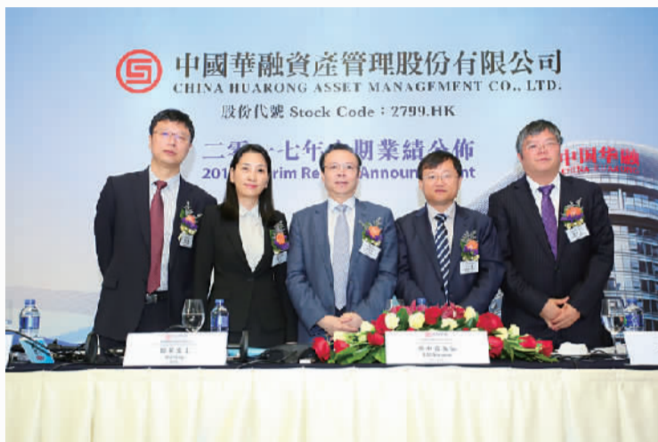
中国华融在港召开2017年中期业绩发布会

加强公司治理体系和治理能力建设，强化“集团资源管控、集团资本管控、集团风险管控、集团财务管控、集团组织管控”“五大管控”，健全“五位一体”的治理体系、兼顾效率的制衡体系、科学的决策体