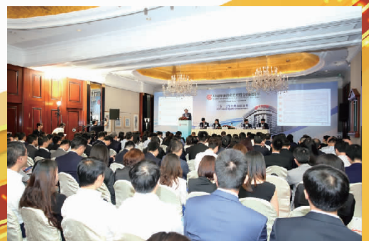
中国华融2017年中期业绩发布会活动现场