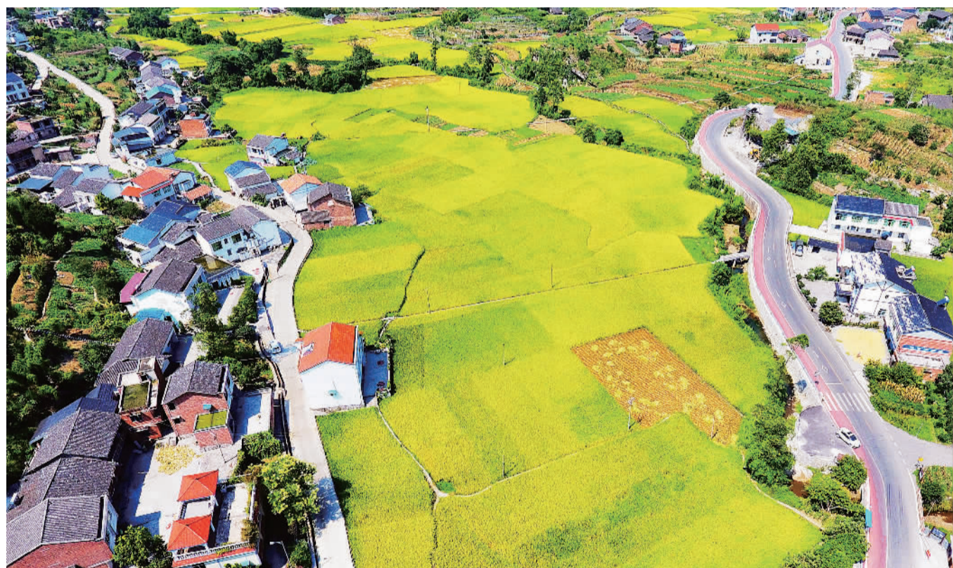
8月23日拍摄的重庆市万盛经开区青年镇董家村乡村公路。近年来,万盛经开区投入大量资金改造山区乡村公路,进一步促进沿线地区旅游资源的综合开发利用,带动沿线乡村旅游经济发展,为农民增收致富创造了条件。

近日,交通运输部还正式印发《全国红色旅游公路规划(2017—2020年)》。《规划》确定了126个红色旅游公路项