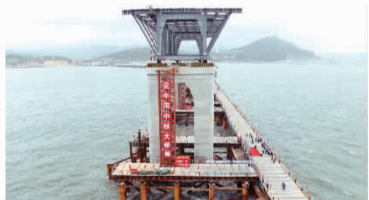
△平潭海峡公铁两用大桥首孔筒支钢桁梁架设成功。

8月21日，《福建省重点流域生态保护补偿办法(2017年修订)》印发执行，提出将全面建立覆盖全省、统一规范的全流域生态保护补偿机制，在资金筹措和分配上向流域上游地区、欠发达地区倾斜。