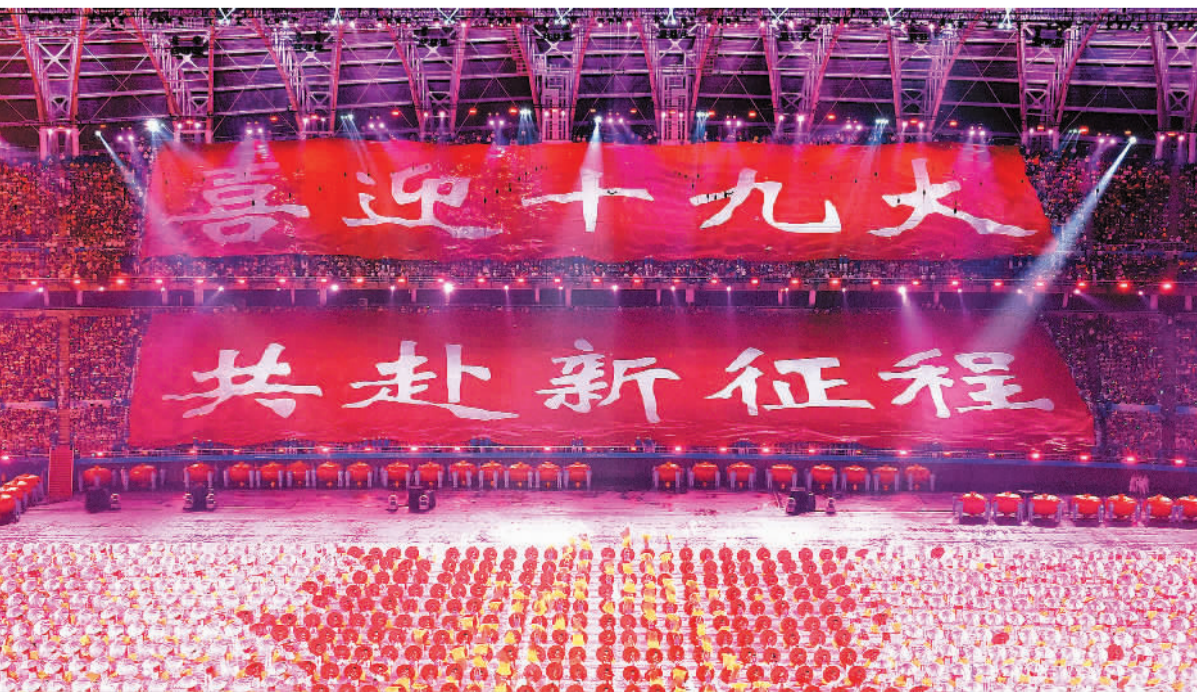
8月27日,中华人民共和国第十三届运动会开幕式在天津举行。图为开幕式现场。

局、协调各方的领导核心作用;与时俱进完善人民代表大会制度;推进协商民主广泛多层制度化发展;全面推进依法治国,加快建设社会主义法治国家;深化行政体制改革,推动政府职能转变;巩固和发展最广泛的爱国统一战线;全面贯彻党的民族政策和宗教政策;加强和改进新形势下党的群团工作。书中收入330段论述,摘自习近平同志2012年11月15日至2017年5月3日期间的讲话、报告、谈话、指示等70多篇重要文献。其中许多论述是第一次公开发表。